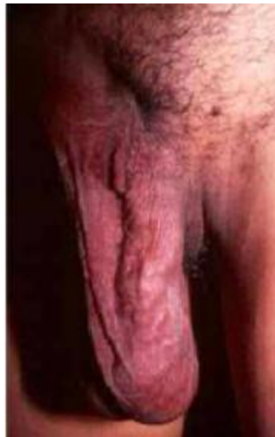
Gambar 2. Daerah Genitalia Ketika Dilakukan Manuver Valsalva

Pada pasien, rencana terapi mencakup pemeriksaan penunjang laboratorium dan USG Skrotum (berdasarkan lampiran laboratorium dari RS. Bhayangkara), administrasi terapi cairan, elevasi skrotum, serta pemberian terapi simptomatik yang disesuaikan dengan keluhan awal. Edukasi juga diberikan untuk mempersiapkan pasien menjalani prosedur operasi di Rumah Sakit.