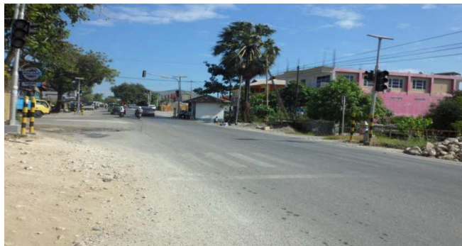
Gambar 3. Segmen Awal Jalan Raya Pekanbaru - Bangkinang KM 07+000

Jalan Raya Pekanbaru - Bangkinang KM 08 dimulai dari titik depan SPBU Bangkinang dan berakhir di depan mini market Alfamart, dengan tata guna lahan campuran, yakni pertokoan/ kios, bengkel motor, rumah makan/ warung, bank, serta perumahan/ kos-kosan. Segmen awal dan akhir KM 07 dan KM 08 jalan Raya Pekanbaru - Bangkinang dapat dilihat pada Gambar 3, 4 dan 5.