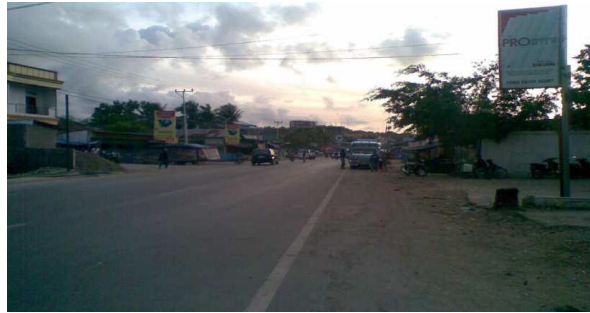
Gambar 5. Segmen Akhir Jalan Raya Pekanbaru - Bangkinang KM 08+000