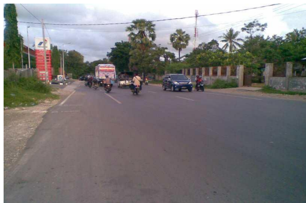
Gambar 4. Segmen Awal Jalan Raya Pekanbaru - Bangkinang KM 08+000