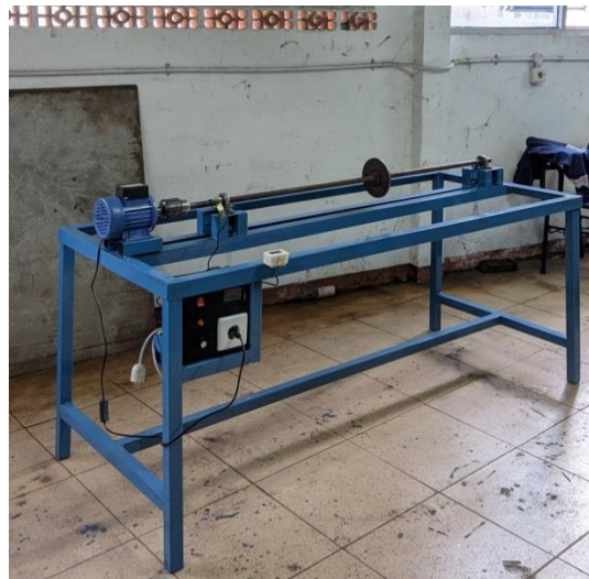
Gambar 3. Hasil Pembuatan

Hasil pembuatan Alat Uji Putaran Kritis Poros dapat dilihat pada gambar 5.1 dibawah ini.