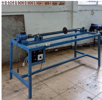
Gambar 5. Hasil Pembuatan

Hasil pembuatan Alat Uji Putaran Kritis Poros dapat dilihat pada gambar 5.1 dibawah ini.