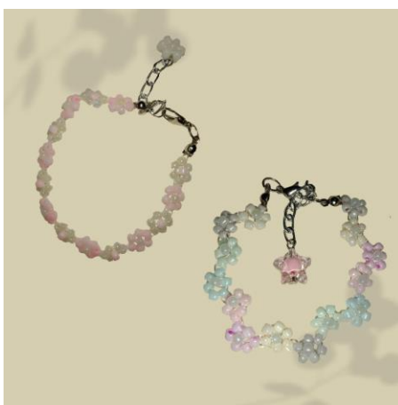
Gambar 1. Produk Gelang

Kami mempersembahkan inovasi yang menarik yaitu gelang manik dengan menghabiskan Rp200.000,00 untuk modal awal. Biaya tersebut mencakup pembelian perlengkapan dasar seperti manik-manik, senar, dan bahan lain seperti kemasan. Kami memfokuskan untuk membuatnya terlihat bersih dan rapi, karena barang yang terlihat bersih akan terlihat lebih baik. dan memiliki kualitas yang lebih tinggi. Serta memastikan setiap gelang dibungkus dalam kemasan yang baik dan ramah dikantong mahasiswa. Dalam proses produksi, penting juga untuk mempertimbangkan efisiensi waktu dan kualitas. Salah satunya dengan melakukan pemeriksaan untuk menjamin semua barang dalam kondisi sempurna sebelum dijual ke konsumen.