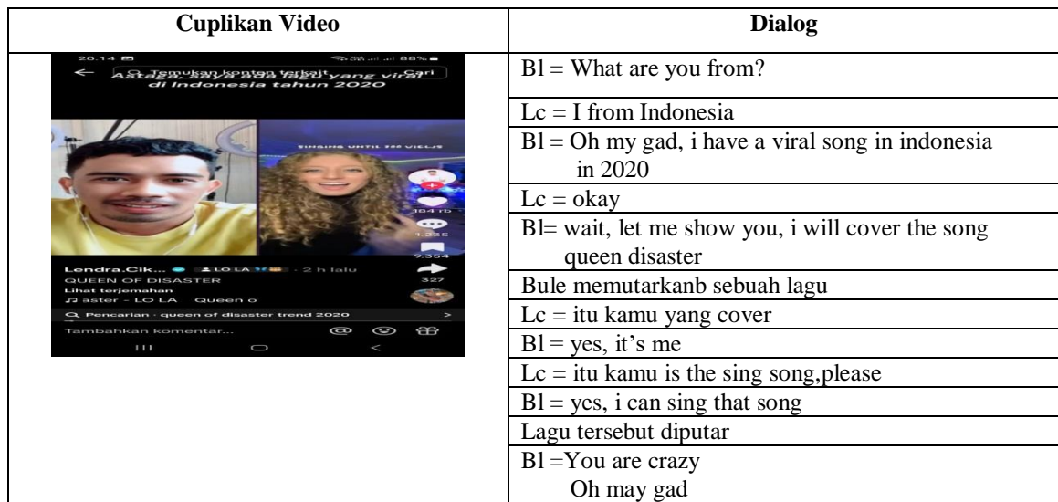
Tabel 1. Penggunaan Bahasa Asing