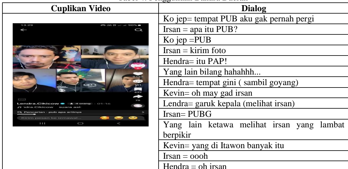
Tabel 4. Penggunaan Bahasa Daerah