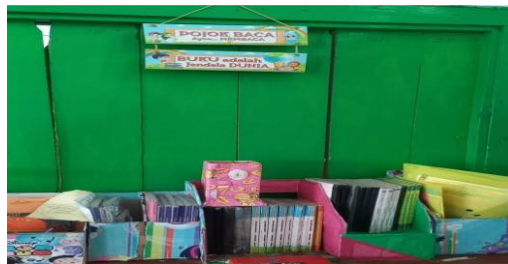
Gambar 6. Dokumentasi kegiatan

Pembuatan pojok asik adalah di setiap sudut kelas. Tujuan pojok asik ini adalah agar siswa-siswi bisa memiliki minat baca yang lebih tinggi. Adapun buku yang akan diletakkan di pojok asik, kami kumpulkan dari hasil donasi. Pojok asik yang kami buat di sudut kelas kami hias menggunakan alat seadanya dengan kreativitas para peserta didik agar menarik untuk dibaca oleh peserta didik.