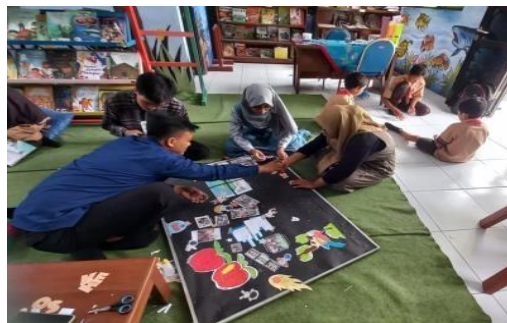
Gambar 4. Dokumentasi kegiatan

Dalam program kerja ini kami akan mengajak peserta didik untuk memanfaatkan mading sebagai media informasi. Hasil dari hari kreatif akan kami pilih kemudian kami tempelkan di mading sekolah dan mading kelas masing-masing. Pada saat penempelan kami akan melakukannya bersama peserta didik kemudian kami akan menghias mading kelas ataupun mading sekolah, hal ini dilakukan dengan tujuan agar mading mendapatkan daya tarik untuk dibaca oleh peserta didik.