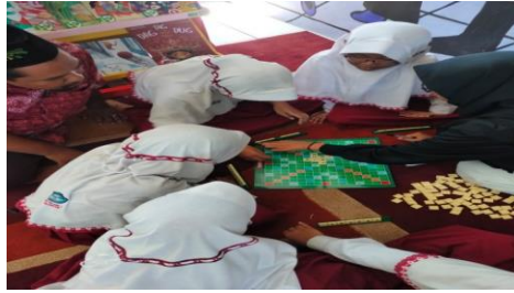
Gamabr 5 . dokumentasi kegiatan