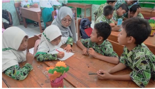
Gambar 2. Dokumentasi kegiatan