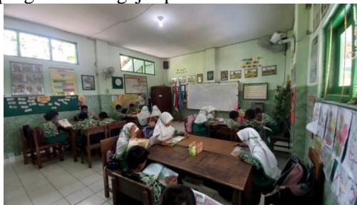
Gambar 1. Dokumentasi kegiatan

Program kerja membaca rutin merupakan program kerja yang kami jalankan secara kondisional setiap hari di SDN Gelang 1. Dimana kita mengintruksikan para peserta didik untuk setiap hari membaca. Buku bacaan yang peserta didik baca bisa bersumber dari buku pelajaran teknisnya sebelum pelajaran dimulai para peserta didik membaca buku pelajarannya terlebih dahulu, selain buku pelajaran para peserta didik juga membaca buku bacaan dari pojok baca yang ada di kelas. Para peserta didik membaca selama kurang lebih 5 menit hingga 10 menit kemudian kita review bersama, dengan cara siswa menceritakan kembali hasil bacaannya di kelas serta tanya jawab di kelas. Untuk siswa yang membacanya kurang lancar kami dari mahasiswa membantu untuk mendampingi dan mengajar para siswa.