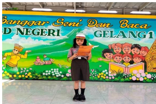
Gamabr 7. Dokumentasi kegiatan

Literasi kreasi ini adalah program kerja yang kami laksanakan dihari hari tertentu saja seperti pada hari pahlawan, hari santri nasional dan hari-hari besar lainnya. Dalam program ini kita akan mengasah kreativitas peserta didik dan melatih mental peserta didik. Pada program kerja ini nanti kita kan banyak sekali lomba-lomba yang akan kita laksanakan untuk mengasah kemampuan peserta didik.