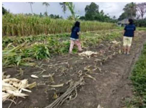
Gambar 4. Dokumentasi. Kegiatan