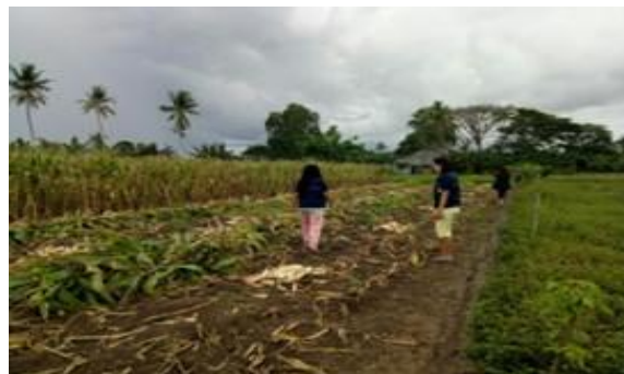
Gambar 3. Dokumentasi. Kegiatan