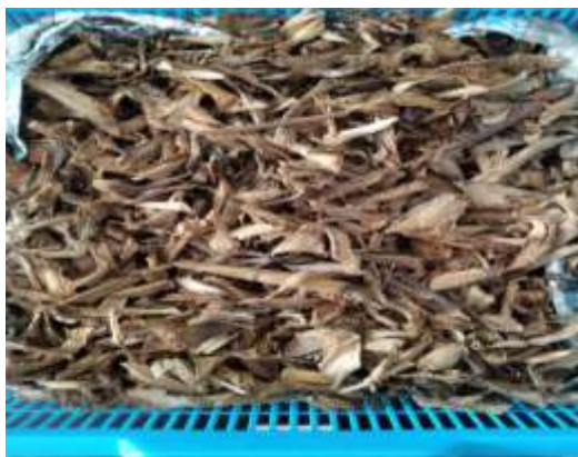
Gambar 1. Batang Pisang Sebagai Sumber Karbon Aktif

Tanaman pisang merupakan salah satu hasil pertanian yang banyak ditemukan di seluruh Indonesia. Masyarakat Indonesia pada umumnya hanya mengkonsumsi buah dan menggunakan daun untuk keperluan rumah tangga. Batang pisang masih sangat jarang digunakan dan dianggap sebagai limbah. Dalam penelitian ini sampel batang pisang dipotong kecil-kecil dan dipindahkan kedalam wadah kemudian dikeringkan. Proses pengeringan sampel batang pisang yang telah dipotong kecil-kecil disajikan pada (Gambar 1). Setelah itu serbuk batang pisang yang telah dipotong kecil-kecil akan direndam menggunakan HCl 2M. Serbuk batang pisang sebelum dan sesudah dilakukan perendaman menggunakan HCl 2M disajikan pada Gambar 2 dan 3.