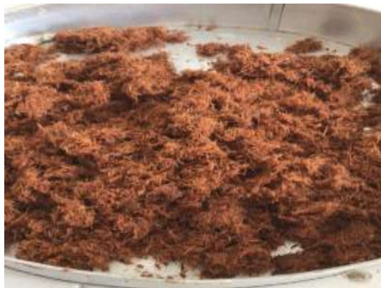
Gambar 3. Serbuk Batang Pisang Setelah Perendaman Menggunakan HCl 2M

Pada penelitian ini limbah batang pisang dimanfaatkan sebagai bahan pembuatan karbon aktif untuk diaplikasikan sebagai adsorben gas H 2 S atau asam sulfida. Batang pisang terlebih dahulu dipotong kecil-kecil lalu kemudian dibersihkan dan dikeringkan. Batang pisang yang sudah dikeringkan tersebut kemudian dihaluskan dan kemudian diberi perlakuan perendaman menggunakan HCl 2M. Perendaman tersebut dimaksudkan untuk menghilangkan berbagai pengotor yang dapat mempengaruhi karbon aktif yang dihasilkan. Karbon aktif disintesis dengan menggunakan tiga temperatur aktivasi, yaitu 250 oC, 350 oC, dan 750oC. Untuk mengetahui karakter adsorben yang telah dihasilkan, dilakukan karakterisasi FTIR pada tiap karbon aktif.