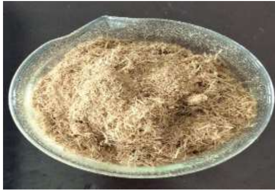
Gambar 2. Serbuk Batang Pisang Sebelum Perendaman Menggunakan HCl 2M