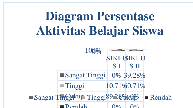
Gambar 1: Grafik Persentase Aktivitas Belajar Siswa

Diagram menunjukkan bahwa hasil observasi aktivitas belajar siswa pada siklus I adalah jumlah siswa yang memiliki aktivitas belajar kategori sangat tinggi tidak ada, tinggi 3 siswa atau 10,71%, cukup 25 siswa atau 89,28%. Dapat disimpulkan bahwa kategori aktivitas belajar siswa pada siklus I dalam kategori moderat dan belum berhasil mencapai ketuntasan belajar, dengan demikian tindakan perlakuan dilanjutkan ke siklus II.