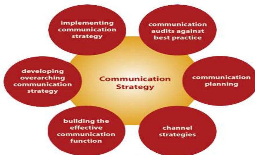
Gambar 1. Commuc=nicatoin strategy