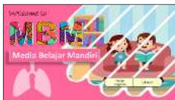
Gambar 2. Aplikasi MBM

Tahap terakhir dari pengembangan aplikasi MBM adalah evaluation . Pada tahap ini, peneliti telah melakukan evaluasi formatif yang telah dilaksanakan pada tahap-tahap sebelumnya. Evaluasi formatif merupakan evaluasi untuk memperbaiki kualitas produk yang dikembangkan agar memiliki efektivitas dan efisiensi yang tinggi. Berdasarkan evaluasi formatif yang telah dilakukan, peneliti mendapatkan nilai, harga, dan manfaat dari aplikasi MBM telah sesuai dengan fungsi dan manfaat dari media pembelajaran.