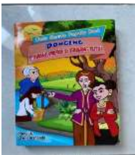
Gambar 2. Desain Awal

Validasi ahli media bertujuan untuk menilai aspek tampilan visual media pembelajaran. Aspek dalam media yang dikembangkan dan divalidasi oleh Dosen Prodi PGSD yaitu Bapak Sutrisno Sahari, S.Pd.,M.Pd. selaku dosen Media Pembelajaran di Universitas Nusantara PGRI Kediri dengan menggunakan skala 1 sampai 5. Berdasarkan Kriteria menurut Riduwan (2015:15) jika persentase 81% - 100% termasuk dalam kriteria sangat valid dan sangat baik digunakan, sedangkan analisis data validasi ahli media menunjukkan \frac{46}{50} \times 100 = 92\% . Jadi, dapat disimpulkan bahwa media pembelajaran Pop-Up Book sangat baik digunakan.