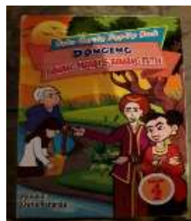
Gambar 3. Desain Akhir

Validasi ahli materi pada penelitian ini dilakukan dengan validasi kepada dosen ahli materi yaitu Bapak Abdul Aziz Hunaifi, S.S.,M.A. selaku dosen Bahasa Indonesia di Universitas Nusantara PGRI Kediri dengan menggunakan skala 1 sampai 5. Berdasarkan Kriteria menurut Riduwan (2015:15) jika persentase 61% - 80% termasuk dalam kriteria dapat digunakan dengan revisi kecil, sedangkan analisis data validasi ahli materi menunjukkan \frac{40}{50} \times 100 = 80\% , jadi dapat disimpulkan bahwa media pembelajaran Pop-Up Book dapat digunakan dengan revisi kecil pada bagian lembar evaluasi siswa dengan masukan pertanyaan harus fokus terhadap identifikasi tokoh-tokoh.