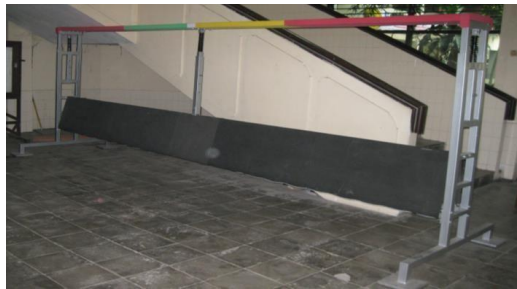
Gambar 2. Alat Tumpuan Olahraga Panco Air

Selanjutnya, dari design yang sudah dibuat, alat tumpuan yang sudah dikembangkan kemudian di produksi. Adapun alat tumpuan yang sudah diproduksi bisa di lihat pada Gambar 2.