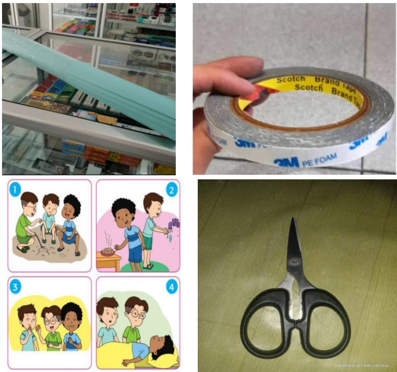
Gambar 1. Alat dan Bahan

Pada siklus I ini dilaksanakan tes individu berupa tes menulis karangan. Adapun data skor hasil belajar siklus I dapat dilihat pada tabel berikut ini: