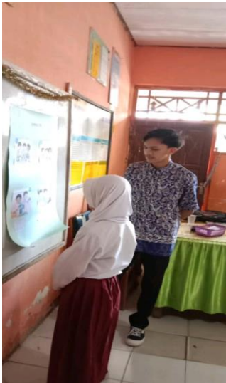
Gambar 2. Proses penerapan Media Gambar Seri