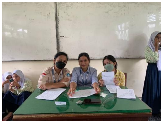
Gambar 3. Pelaksanaan kegiatan membantu administrasi sekolah

Analisis hasil pelaksanaan Program Kampus Mengajar Angkatan IV dalam membantu administrasi sekolah telah sesuai dengan ketercapaian tujuan yang diharapkan oleh program kampus mengajar yaitu melengkapi perangkat pembelajaran yang meliputi RPP, Bahan Ajar, materi pembelajaran dan media pembelajaran, membantu guru dalam mengawasi siswa saat Ujian Tengah Semester dilaksanakan, membantu guru dalam pendataan siswa yang akan mengikuti Imunisasi di sekolah, dan membuat penilaian kejuaraan pada saat perlombaan hari guru dilaksanakan di sekolah. Dampak positif bagi guru dapat meringankan tugas guru dan bagi mahasiswa dapat memperoleh pengalaman dan ilmu yang bermanfaat dalam menyusun administrasi dan mengolah perangkat pembelajaran.