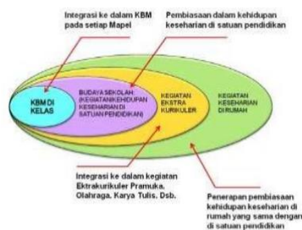
Gambar 1. Konteks Mikro Pendidikan Karakter Kemdiknas (2011, p.8)

Dalam rancangan pembangunan karakter yang dicanangkan pemerintah, sekolah sebagai satuan pendidikan perlu diberdayakan sebagai sebuah strategi. Pendidikan karakter di sekolah termasuk dalam konteks mikro pendidikan karakter, bagian yang termasuk di dalamnya meliputi; (1) pembelajaran di kelas, (2) kegiatan sehari-hari di sekolah (kultur sekolah), (3) kegiatan kokurikuler dan ekstrakurikuler. Strategi pendidikan karakter tersebut digambarkan dalam sebuah bagan berikut: