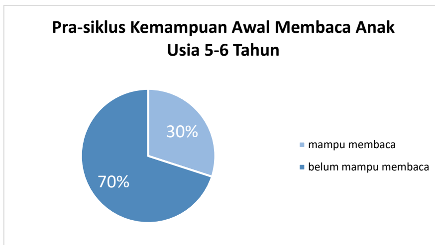
Gambar 1. Kemampuan membaca awal anak usia 5-6 tahun

Berdasarkan Table 1 dan Diagram 1 di atas menunjukkan bahwa kemampuan awal membaca anak usia 5-6 tahun di RA Khoiru Ummah belum berkembang sesuai harapan dimana 14 orang anak belum mampu membaca tidak hanya membaca masoh terdapat anak yang kesulitan dalam menyebutkan huruf, menunjukkan huruf, ataupun membedakan huruf sehingga berpengaruh dengan suku kata dan kalimat sederhana, adapaun yang mampu mengenal suku kata tetapi kesulitan membaca sehingga masih ada huruf yang tidak dibaca. 6 orang anak mampu membaca dengan baik seperti mampu mengenal huruf, suku kata dan membaca kalimat sederhana. Dengan presentase yang didapatkan yaitu 30% anak yang mampu membaca dan 70% anak yang belum mampu membaca.