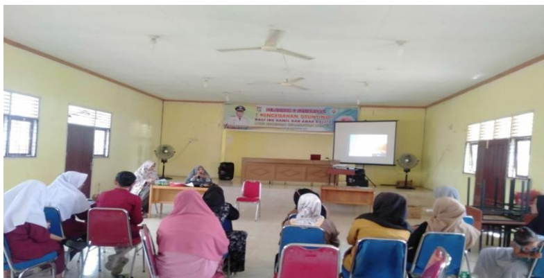
Gambar 1. Kegiatan dilaksanakan tanggal 20 Desember 2021

Kegiatan Pengabdian Kepada Masyarakat telah dilaksanakan pada hari Senin, tanggal 20 Desember 2021, di Aula Desa Naumbai Kecamatan Kampar Kabupaten Kampar. Kegiatan pengabdian ini dilaksanakan untuk kader dalam meningkatkan pengetahuan dan kemampuannya dalam mengenal tumbuh kembang balita. Pelaksanaan Pengabdian Masyarakat berjalan dengan baik dan tepat sasaran. Pelaksanaan pengabdian kepada masyarakat dihadiri oleh 13 orang kader. Hasil pelatihan rata-rata kader memahami materi edukasi dan mampu melakukan praktik SDIDTK dengan menggunakan instrumen KPSP dengan baik, namun ada sebagian kader perlu pendampingan sehingga kader bisa memahami dengan baik. Kader Posyandu Desa Naumbai yang mengikuti kegiatan pelatihan ini sudah mampu mengenal Tumbuh Kembang sesuai usia anak. Pada saat pelatihan ini Bayi dan balita yang dinilai perkembangannya diperoleh hasil sesuai dan normal sesuai usia anak. Jumlah balita yang dinilai sebanyak 15 anak. Pada kegiatan pelatihan ini tidak memungkinkan menilai semua usia perkembangan anak dikarenakan keterbatasan variasi umur balita yang ikut serta pada saat kegiatan.