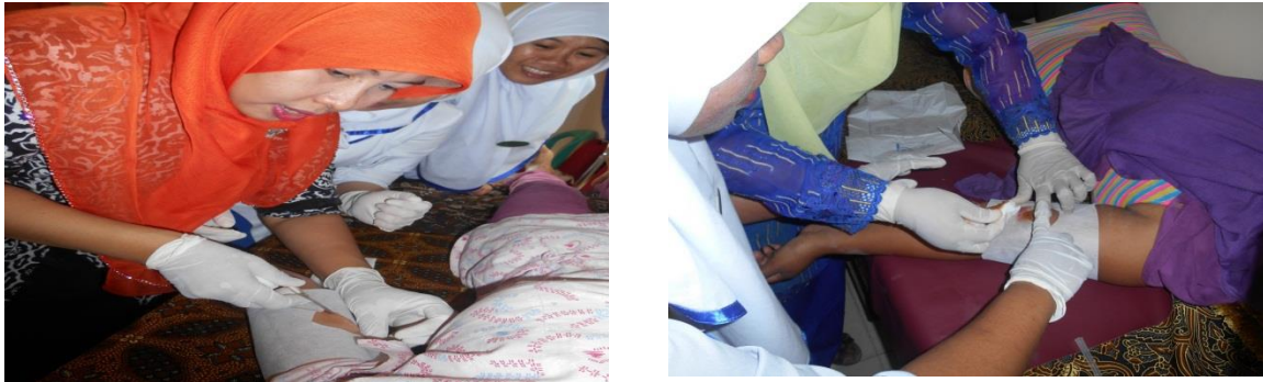
Gambar 1 Pemasangan alat kontrasepsi (Implant)

Penyuluhan dilakukan dengan menggunakan metode ceramah untuk menyampaikan apa itu alat kontrasepsi, apa manfaatnya, apa keuntungan dan kerugian masing-masing alat kontrasepsi. Kemudian melakukan pemasangan alat kontrasepsi sesuai pilihan dan keinginan klien.