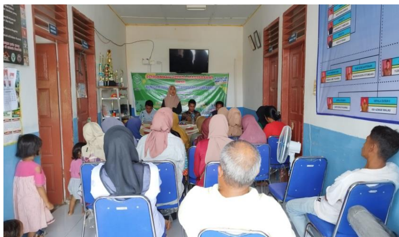
Gambar 3. Narasumber memberikan materi kepada masyarakat Sorkam Tengah