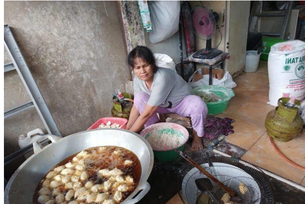
Gambar 1. UKM warga Desa Sorkam Tengah

Ini bisa dilakukan bersamaan dengan menciptakan suatu transformasi dalam memasarkan bentuk usaha yang dimilikinya khususnya UMKM. Sorkam adalah sebuah kecamatan di Kabupaten Tapanuli Tengah, Sumatra Utara, Indonesia. Ibu kota kecamatan ini berada di kelurahan Sorkam. Jumlah penduduk kecamatan ini pada tahun 2021 sebanyak 16.511 jiwa, dengan kepadatan penduduk 205 jiwa/km 2 . Masyarakat yang berada di desa Sorkam Tengah ini memiliki usaha rumahan seperti keripik singkong, keripik yang terbuat dari ikan asin, dan berbagai jenis makanan khas Sorkam. Ini menjadi produk lokal yang perlu dikembangkan dengan memanfaatkan hasil sumber alam yang mendukung perekonomian daerah tersebut. Promosi dilakukan agar produk yang dijual dikenal oleh masyarakat luas dan meningkatkan nilai penjualan (Dinda Sekar, 2019). Contoh dari penerapan industri 4.0 di Indonesia sendiri dapat kita lihat pada industri makanan, minuman, tekstil, otomotif, elektronik, serta kimia. Contohnya adalah adanya kebijakan e-smart IKM (sistem database Industri Kecil Menengah) yang diberikan kepada pelaku usaha agar mempromosikan produk yang ditawarkan melalui platform digital supaya proses pemasarannya lebih aktif.