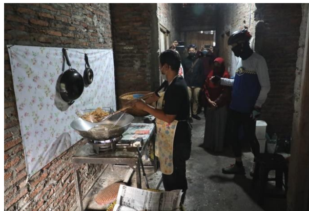
Gambar 2. Pelaku UKM di Desa Sorkam

Ini bisa dilakukan bersamaan dengan menciptakan suatu transformasi dalam memasarkan bentuk usaha yang dimilikinya khususnya UMKM. Sorkam adalah sebuah kecamatan di Kabupaten Tapanuli Tengah, Sumatra Utara, Indonesia. Ibu kota kecamatan ini berada di kelurahan Sorkam. Jumlah penduduk kecamatan ini pada tahun 2021 sebanyak 16.511 jiwa, dengan kepadatan penduduk 205 jiwa/km 2 . Masyarakat yang berada di desa Sorkam Tengah ini memiliki usaha rumahan seperti keripik singkong, keripik yang terbuat dari ikan asin, dan berbagai jenis makanan khas Sorkam. Ini menjadi produk lokal yang perlu dikembangkan dengan memanfaatkan hasil sumber alam yang mendukung perekonomian daerah tersebut. Promosi dilakukan agar produk yang dijual dikenal oleh masyarakat luas dan meningkatkan nilai penjualan (Dinda Sekar, 2019). Contoh dari penerapan industri 4.0 di Indonesia sendiri dapat kita lihat pada industri makanan, minuman, tekstil, otomotif, elektronik, serta kimia. Contohnya adalah adanya kebijakan e-smart IKM (sistem database Industri Kecil Menengah) yang diberikan kepada pelaku usaha agar mempromosikan produk yang ditawarkan melalui platform digital supaya proses pemasarannya lebih aktif.