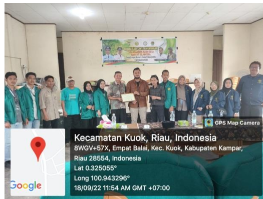
Gambar 1. Sosialisasi cinta lingkungan

Program sosialisasi cinta lingkungan ini ditujukan agar masyarakat memiliki karakter cinta pada lingkungan lebih dalam. Manusia sebagai pengelola lingkungan hidup memegang peranan penting dalam menjaga kelestarian lingkungan. Oleh karena itu perlu ditanamkan semangat cinta lingkungan pada masyarakat. Karena masyarakat merupakan motoric penggerak paling penting.