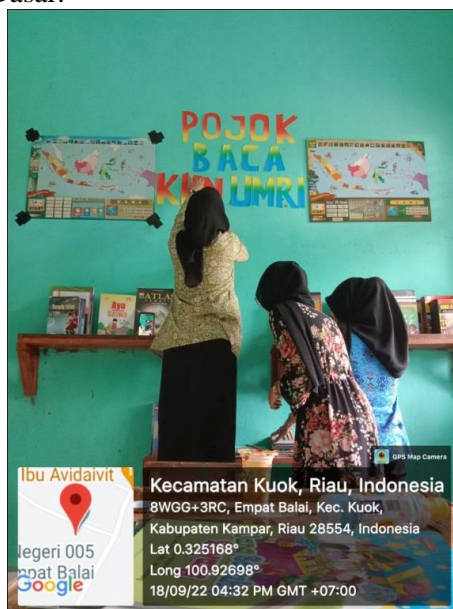
Gambar 8. Membuat pojok baca

Pojok baca sangat membantu menumbuhkan minat membaca siswa di kelas, peran pojok baca dalam menumbuhkan minat membaca siswa yaitu, sebagai fasilitator tempat membaca, sebagai bahan bacaan terdekat, tempat membaca yang nyaman dan tempat membaca yang menarik perhatian, sehingga dari beberapa peran tersebut membantu menumbuhkan minat membaca siswa di Sekolah Dasar.