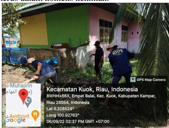
Gambar 7. Gotong royong

Gotong royong merupakan salah satu akar peradaban yang dimiliki oleh bangsa Indonesia dan menjadi landasan kehidupan berbangsa dan bernegara. Nilai tersebut sudah selayaknya tetap menjadi pondasi kehidupan dalam hidup bermasyarakat dan bernegara. Walaupun harus kita akui, bahwa kondisi sosial, ekonomi dan politik masyarakat Indonesia saat ini, sangat rentan untuk melunturkan nilai-nilai tersebut. Globalisasi, kemiskinan dan situasi politik yang tidak menentu disebut-sebut sebagai faktor utama yang menyebabkannya. Tulisan ini hendak mengkaji pentingnya nilai kebersamaan dalam masyarakat yang menjelma menjadi gotong royong ini melandasi kehidupan bangsa Indonesia, sudah seharusnya revitalisasi gotong royong ini harus kita upayakan secara terus menerus dalam konteks kekinian.