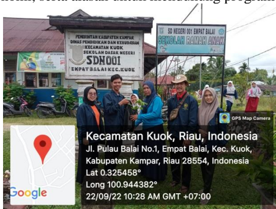
Gambar 4. Penghijauan Penanaman Bibit Pohon Dan Bibit Buah-Buahan

Penghijauan merupakan salah satu kegiatan penting yang harus dilaksanakan secara konseptual dalam menangani krisis lingkungan. Desa Empat Balai merupakan salah satu desa yang cukup aktif dalam mendukung program penghijauan. Dalam upaya penyelamatan lingkungan, masyarakat bersama tim knn telah melakukan berbagai kegiatan penghijauan. Masyarakat menilai kondisi ruang hijau di desa saat ini sudah sangat minim. Kegiatan penghijauan dilakukan oleh masyarakat dengan berbagai motif, antara lain : untuk menambah nilai ekologi, manambah nilai estetika, mendapatkan manfaat ekonomi, serta alasan untuk mendukung program pemerintah.