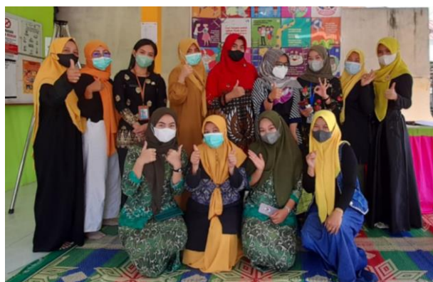
Gambar 2: Dokumentasi Bersama; mahasiswa, dosen, kader dan Petugas Kesehatan