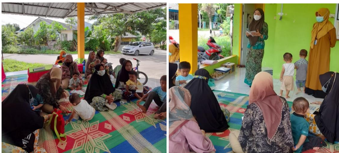
Gambar 1: Kegiatan saat Pelaksanaan Penyuluhan

Selama proses kegiatan yang dilakukan dalam pengabdian kepada masyarakat ini dapat mempengaruhi beberapa faktor antara lain; kondisi saat penyampaian materi yang kurang kondusif karena para ibu balita membawa balitanya aktif sehingga terkadang fokus ibu balita teralihkan dari materi yang disampaikan. Hal ini merupakan kendala dalam pelaksanaan pengabdian kepada masyarakat di pelayanan kesehatan wilayah setempat.