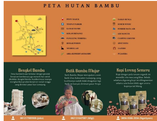
Gambar 8. Brosur Halaman Kedua