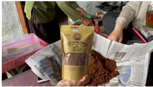
Gambar 6. Hasil Produksi Kopi Lereng Semeru

Dalam mengembangkan objek wisata dan UMKM, penulis membuat luaran-luaran yang bertujuan untuk branding seperti brosur, katalog paket wisata, promosi melalui media sosial dan video profil desa. Berikut penjelasan luaranyang dibuat: