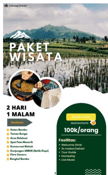
Gambar 9. Contoh Katalog Paket Wisata