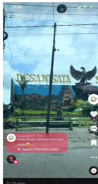
Gambar 11. Video Tiktok

TikTok ini dibuat oleh penulis bertujuan untuk salah satu promosi desa wisata sumbermujur di media sosial. Penulis beranggapan bahwa TikTok cepat untuk menyebarkan informasi atau promosi. TikTok juga memiliki jangkauan yang luas sehingga para penonton TikTok dapat mengetahui segala informasi. TikTok yang dibuat penulis terdapat video profil desa singkat serta potensi wisata dan UMKM yang ada di Desa Sumbermujur. Unggahan video tiktok penulis mendapat umpan balik yang positif dengan mendapat view kurang lebih 100 penonton.