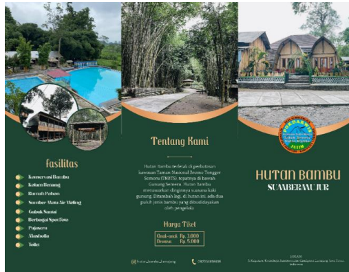
Gambar 7. Brosur Halaman Pertama