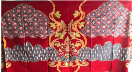
Gambar 5. Contoh Batik Bambumujur

corak atau motif yang khas yaitu bambu. Batik ini juga menggunakan warna alam sehingga warna yang diperoleh bernuansa alami.