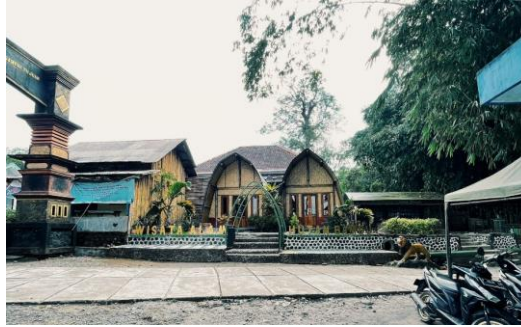
Gambar 2. Wisata Hutan Bambu