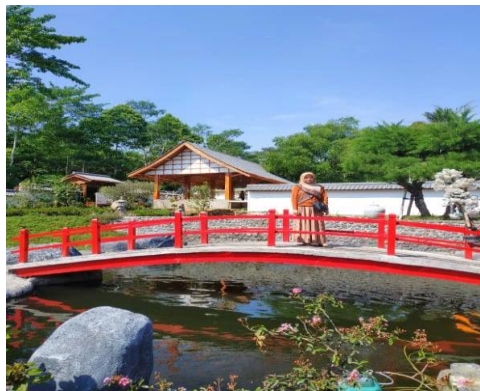
Gambar 3. You and I Garden