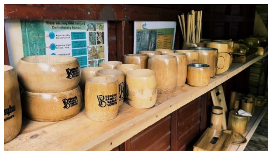
Gambar 4. Hasil Produksi Bengkel Bambu