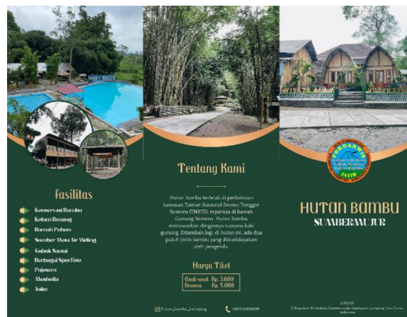
Gambar 3. Brosur Hutan Bambu

Brosur yang dihasilkan terbuat dari kertas AP (Art Paper) mengenai objek wisata hutan bambu yang berada di Desa Sumbermujur dengan logo POKDARWIS sebagai logo utama. Pada halaman pertama brosur berisi tentang informasi mengenai fasilitas yang terdapat di hutan bambu seperti konservasi bambu, kolam renang, rumah pohon, sumber mata air weling, gubuk santai, berbagai spot foto, pujasera, musholla dan toilet. Dalam brosur tersebut juga terdapat informasi tambahan mengenai hutan bambu dan harga tiket dengan dua kategori yaitu anak-anak sebesar Rp. 3.000 dan dewasa sebesar Rp. 5.000. Sementara itu pada halaman kedua berisi informasi mengenai peta hutan bambu serta UMKM yang memiliki daya tariknya tersendiri. Terdapat 3 jenis UMKM yang disajikan dalam brosur antara lain bengkel bambu yang terkenal dengan penghasil produk koleksi kerajinan dari bambu, batik bambu mujur yang terkenal dengan corak dan motif khas desa sumbermujur serta kopi lereng semeru yang terkenal dengan berbagai cita rasa yang khas dengan pola tanam organik.