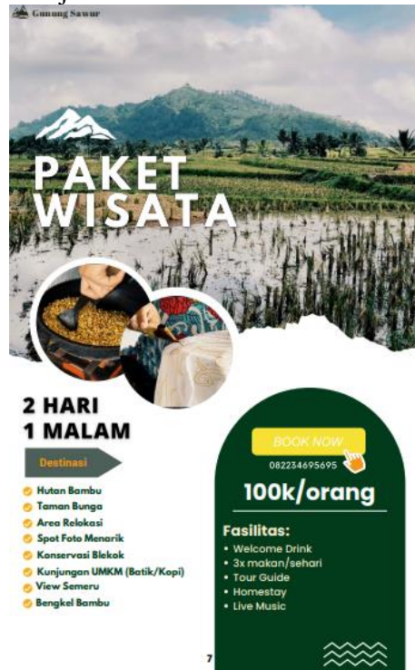
Gambar 2. Paket Wisata 2 Hari 1 Malam Katalog Hutan Bambu

merupakan sebuah komunitas atau pelajar (SD, SMP dan SMA) yang memiliki keinginan untuk mempelajari budaya di Desa Sumbermujur.