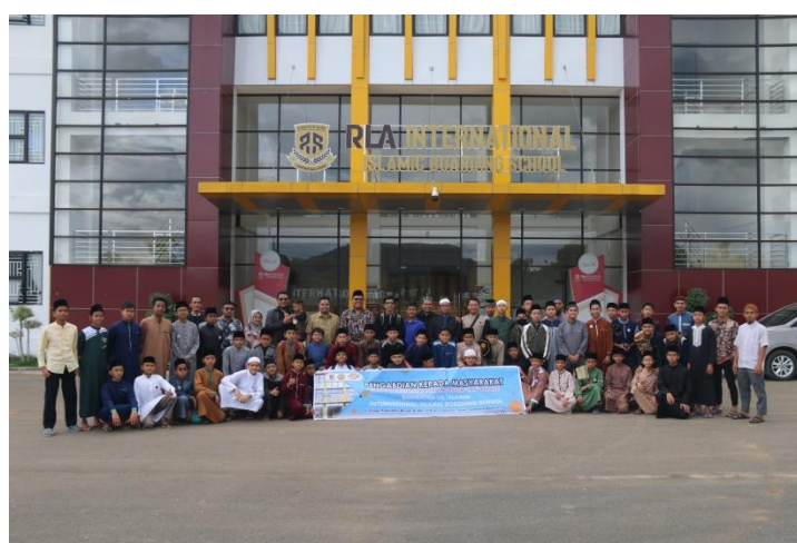
Gambar 6. Foto Bersama Santri RLA

Setelah berakhirnya sosialisasi, tim PKM melakukan foto bersama untuk mendokumentasikan kegiatan pengabdian masyarakat. Semoga ilmu yang diperoleh bermanfaat nantinya.