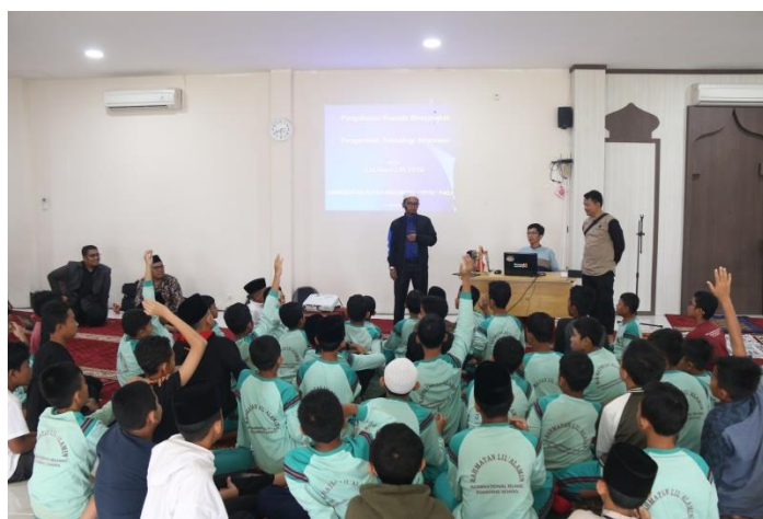
Gambar 5. Sesi Tanya Jawab