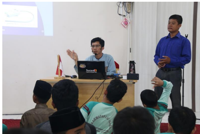
Gambar 4. Penyajian Materi

Penyajian materi yang disampaikan oleh tim PKM ini dan bentuk sosialisasi kepada ma'had. Penyajian dalam bentuk slide power poin . Pengabdian ini yang dilakukan berupa sosialisasi kepada santri Rahmatan Lil 'Alamin International Islamic Boarding School. Sosialisasi ini disambut hangat oleh peserta sehingga acara sosialisasi berjalan dengan lancar.