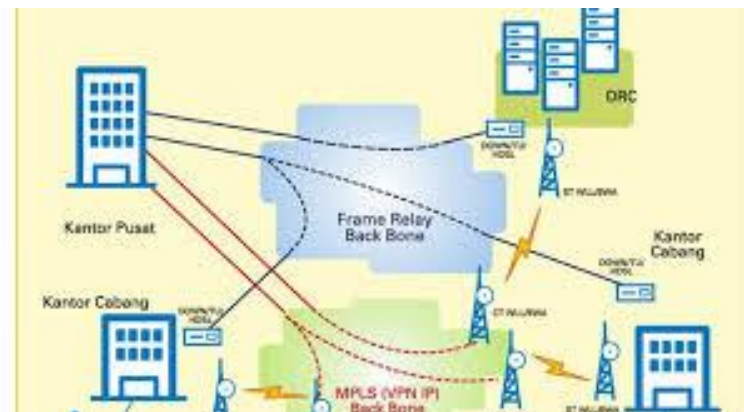
Gambar 2. Jaringan Metropolitan Area Network (MAN)

Metropolitan Area Network (MAN) merupakan jaringan komputer yang cakupan areanya cukup luas, bisa dalam satu kota yang sama. Adapun jarak antara server dengan user antara 5 sampai 50 km. Jenis jaringan ini umum digunakan untuk menghubungkan server dari perusahaan pusat dengan user di kantor cabang.