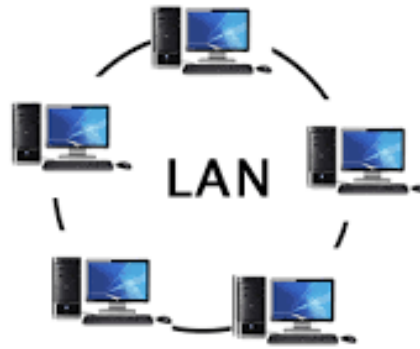
Gambar 1. Jaringan Local Area Network (LAN)

Metropolitan Area Network (MAN) merupakan jaringan komputer yang cakupan areanya cukup luas, bisa dalam satu kota yang sama. Adapun jarak antara server dengan user antara 5 sampai 50 km. Jenis jaringan ini umum digunakan untuk menghubungkan server dari perusahaan pusat dengan user di kantor cabang.