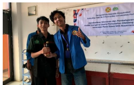
Gambar 2 Pemberian Hadiah Kepada salah satu Siswa yang berhasil menjawab pertanyaan

Tujuan acara ini yaitu untuk mengetahui seberapa jauh para siswa dapat memahami materi yang sudah diberikan oleh panitia. Panitia memberikan beberapa pertanyaan kepada para siswa, jika ada yang berhasil menjawab pertanyaan maka akan diberikan hadiah.