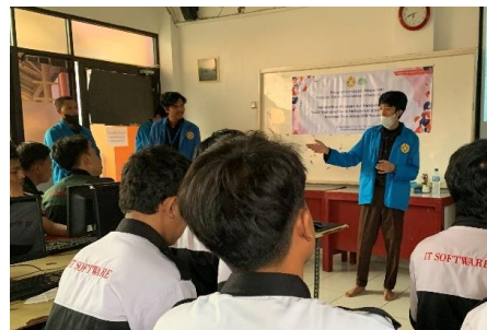
Gambar 3 Sambutan Oleh Ketua PKM