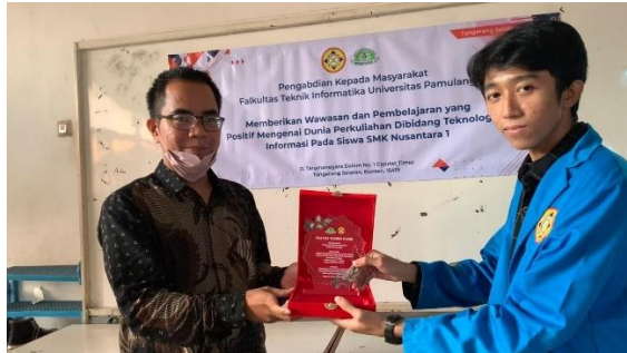
Gambar 3 Pemberian Plakat secara simbolis oleh ketua PKM dengan Pihak Sekolah

Ini merupakan rangkaian terakhir dari kegiatan penyuluhan, setelah dirasa cukup dalam penyampaian materi dan menguji pemahaman para siswa, maka acara terakhir yaitu pemberian plakat dan cinderamata. Hal ini dilakukan sebagai ucapan terima kasih karena pihak sekolah sudah bersedia mengizinkan kegiatan ini berlangsung dan juga acara berjalan dengan lancar.