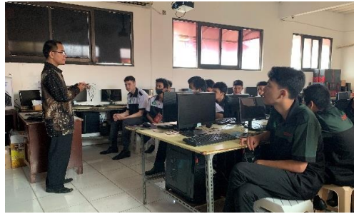
Gambar 2 Acara sambutan dari pihak sekolah