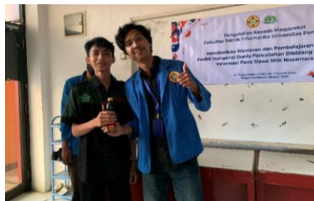
Gambar 2 Pemberian Hadiah Kepada salah satu Siswa yang berhasil menjawab pertanyaan

Tujuan acara ini yaitu untuk mengetahui seberapa jauh para siswa dapat memahami materi yang sudah diberikan oleh panitia. Panitia memberikan beberapa pertanyaan kepada para siswa, jika ada yang berhasil menjawab pertanyaan maka akan diberikan hadiah.