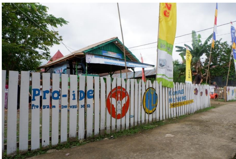
Gambar 2. Taman Bahagia

Pada pekan-5 hingga pekan ke-8, kegiatan diisi dengan psikoedukasi serta bermain di taman bahagia yang telah selesai dibuat. Di sela-sela waktu lainnya, tim berbaur dengan masyarakat dalam adat dan aktivitas mereka, seperti tradisi Islam Maulid Nabi SAW, yasinan, dan lain sebagainya. Pada pekan ke-9 hingga ke-12, kegiatan memasuki fase akhir, yaitu festival anak dan penutupan, serta persiapan lainnya.