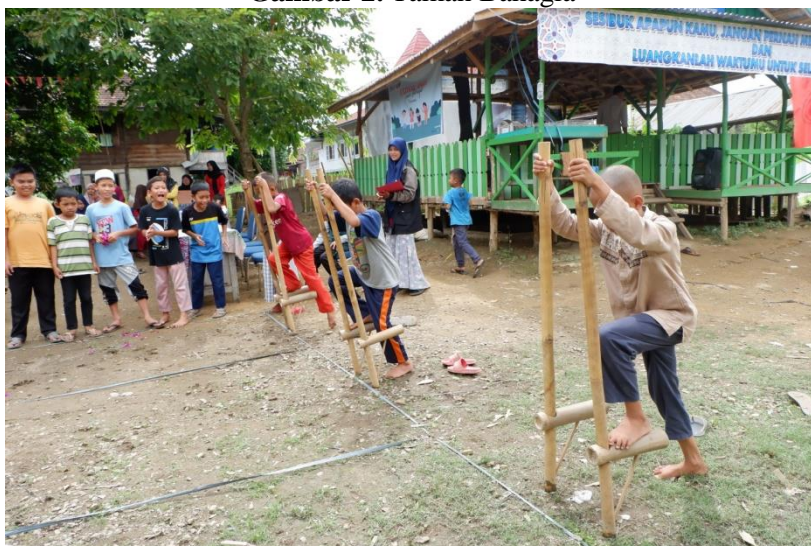
Gambar 3. Permainan Tradisional