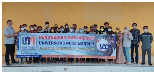
Gambar 4 Tutor dan Peserta

Penyuluhan ini memerlukan waktu sehari saja. Namun untuk implementasinya perlu dilakukan secara rutin agar nantinya para staff kelurahan dan masyarakat menjadi terbiasa dengan berita-berita atau informasi yang diterima. Dan tidak salah menerima informasi yang beredar dan dapat memberikan informasi yang benar kepada pihak-pihak terkait. Sehingga pihak desa danarganya bisa bertukar informasi dengan baik tanpa salah informasi.