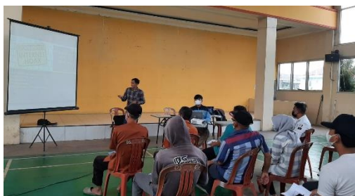
Gambar 3 Penyuluhan Antisipasi Hoax