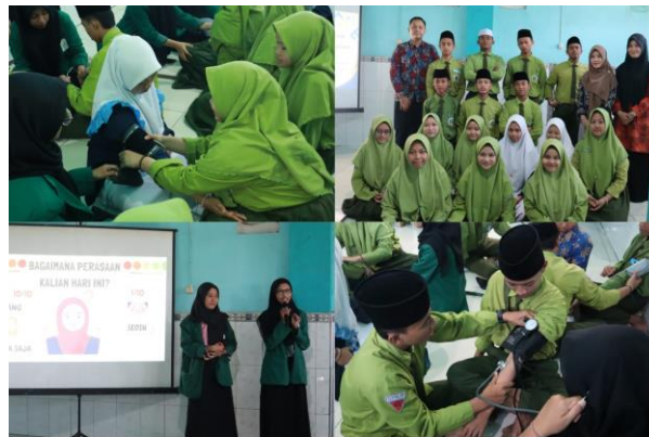
Gambar 1. Pelaksanaan Kegiatan Pengabdian Masyarakat

Pelaksanaan kegiatan pengabdian kepada masyarakat yang dilaksanakan di Pondok Pesantren Burhanul Hidayah ini menunjukkan hasil yang positif. Kegiatan yang dikemas dalam bentuk penyuluhan edukasi mengenai masalah gizi dan stress pada santri di Pondok Pesantren. Berikut merupakan gambaran dari hasil kegiatan pengabdian kepada masyarakat ini :