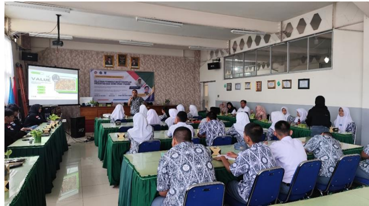
Gambar 3 pemaparan materi pembuatan slide presentasi interaktif

Gambar 3 menjelaskan tentang pemaparan materi yang disampaikan oleh pemateri mengenai praktek tentang pembuatan slide presentasi interaktif