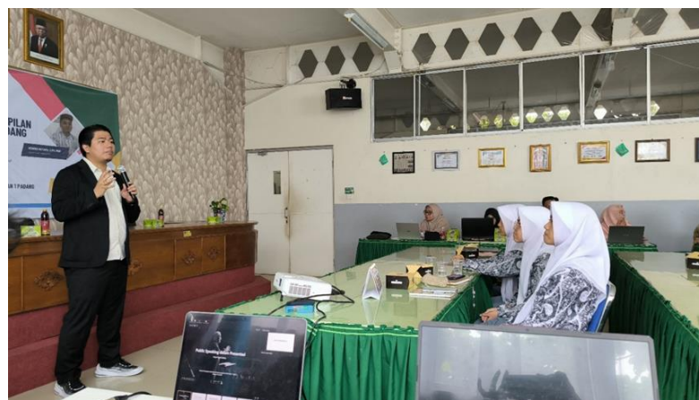
Gambar 4 pemaparan materi public speaking dalam presentasi.

Gambar 3 menjelaskan tentang pemaparan materi yang disampaikan oleh pemateri mengenai praktek tentang pembuatan slide presentasi interaktif