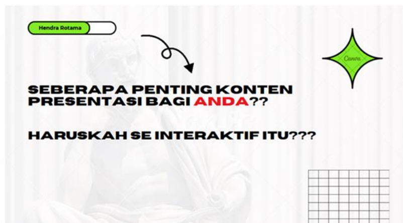
Gambar 2. Konten Presentasi

Narasumber menjelaskan tentang ide konten presentasi, apa yang di incar dari audience, dan nilai apa yang didapatkan audience dari presentasi.