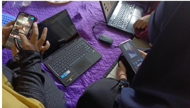
Gambar 2. Pelatihan dan Pendampingan Promosi Digital dengan TikTok

Tahap akhir yaitu evaluasi kegiatan dengan memberikan kuesioner skala likert kepada peserta tentang peningkatan pengetahuan 87%, keterampilan 93%, dan pelayanan 87%. Hasil dari kuesioner dapat dilihat pada gambar 3 berikut.