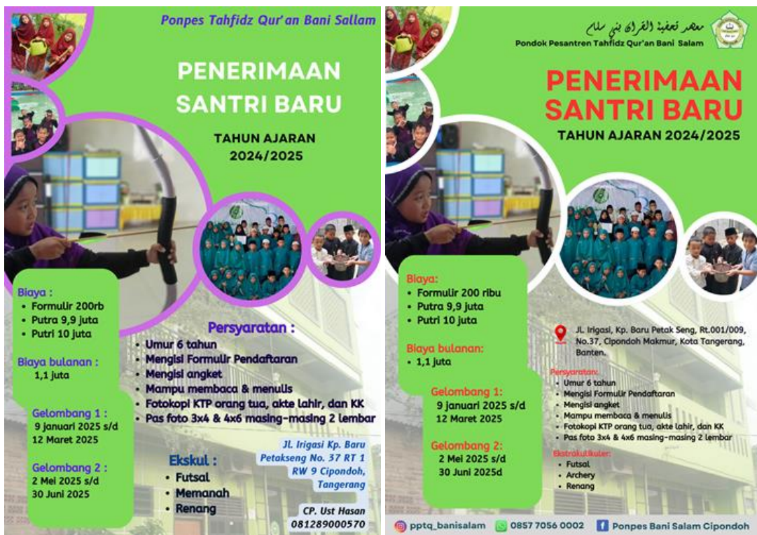
Gambar 1. Desain Flyer Sebelum dan Sesudah Diedit

Pelatihan dan pendampingan dihadiri oleh pengurus yang bertanggung jawab dengan media sosial ponpes dan juga dihadiri oleh beberapa guru. Pelatihan dan pendampingan diawali dengan menjelaskan tentang canva dan kegunaannya. Dilanjutkan dengan latihan membuat desain dengan canva dengan template yang sudah tim PKM buat. Peserta mengedit template sesuai kebutuhan flyer pesantren. Desain yang sudah dibuat menjadi seperti pada gambar 1.