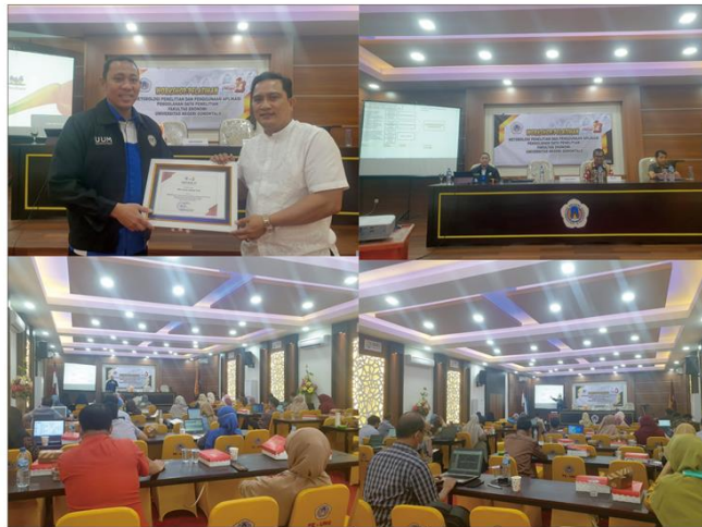
Gambar 1. Dokumentasi Kegiatan

Selain itu, kegiatan ini juga dimuat diberita online melalui web STIM Lasharan Jaya, seperti pada Gambar 2 dibawah ini: