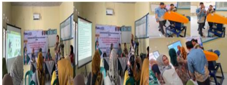
Gambar 1. Pelaksanaan Kegiatan pelatihan dan pendampingan TTG, Manajemen Pengelolaan BUMDes Bina Usaha dan Praktik TTG

Kegiatan Pelatihan dan Pendampingan yang berupa seminar Penerapan Teknologi Tepat Guna ini adalah langkah lanjutan dari program tim PKM Dana Dipa Direktorat Riset, Teknologi Dan Pengabdian Kepada Masyarakat (DPRTM) Kemendibudristek-tahun anggaran 2024, yang sebelumnya setelah diadakannya survey dan juga Pelatihan kepada mitra usaha BUMDes “Bina Usaha” Desa Cinangka. Dalam kegiatan Pelatihan dan Pendampingan ini pemateri menyampaikan pentingnya manajemen pengelolaan BUMDes dan Penggunaan teknologi tepat guna untuk mempermudah pekerjaan yang dilakukan oleh para pelaku usaha agar menghasilkan kuantitas dan kualitas produk yang sesuai. Penyampaian transfer ilmu yang dilaksanakan dalam acara ini adalah dengan menggunakan bantuan media power point yang menjelaskan mengenai pentingnya pengetahuan manajemen pengelolaan BUMDes dan juga penggunaan teknologi dalam pendampingan usaha untuk peningkatkan perekonomian masyarakat setempat ataupun kelompok mitra “Bina Usaha”.