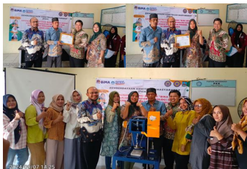
Gambar 3. Mitra BUMDes “Bina Usaha” menerima Teknologi Tepat Guna Mesin Pemipih Biji Melinjo

Tahap Terakhir Kegiatan pengabdian yaitu penyerahan mesin pemipih biji melinjo sebagai sarana transer IPTEK BUMDes mitra “Bina Usaha” dan Sertifikat hasil kegiatan pengabdian kepada Masyarakat.