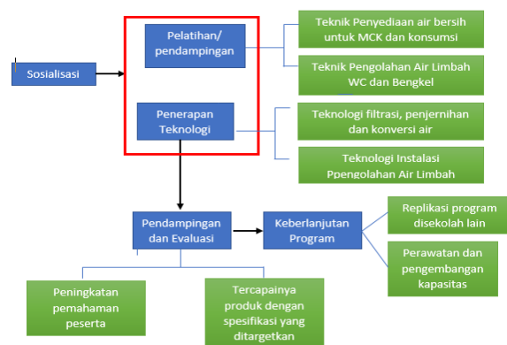
Gambar 1. Tahapan pelaksanaan PKM

Adapun skema pelaksanaan Pemberdayaan Kemitraan Masyarakat seperti pada gambar dibawah ini: