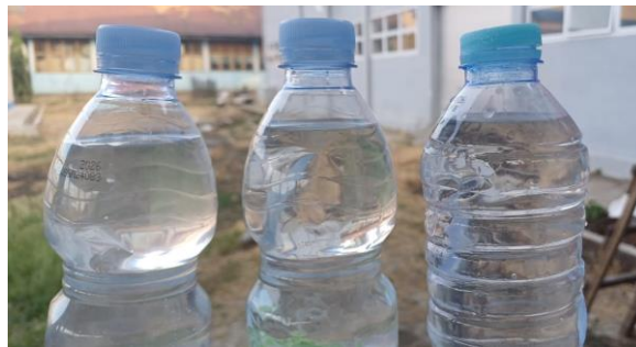
Gambar 2. Perbedaan kejernihan air

Kegiatan inti berupa pelatihan, pendampingan dan penerapan teknologi dilakukan di SMK 5 Takalar yang dihadiri oleh pimpinan sekolah, seluruh guru dan beberapa perwakilan siswa. Setelah kegiatan inti dilaksanakan dilanjutkan dengan implementasi teknologi, sistem penyediaan air bersih menggunakan teknologi filtrasi sederhana terbukti mampu menyediakan air bersih yang layak digunakan oleh siswa, guru, dan staf sekolah. Air yang dihasilkan memenuhi standar kualitas air bersih untuk keperluan sehari-hari, seperti minum, mencuci, dan sanitasi. Sistem pengolahan air limbah yang diterapkan mampu mengurangi kadar pencemaran di air limbah sebelum dibuang ke lingkungan. Teknologi ini menggunakan metode pengolahan anaerobik dan filtrasi untuk menurunkan kadar bahan organik dan kimia berbahaya dalam air limbah. Berikut adalah tampilan warna air secara visual