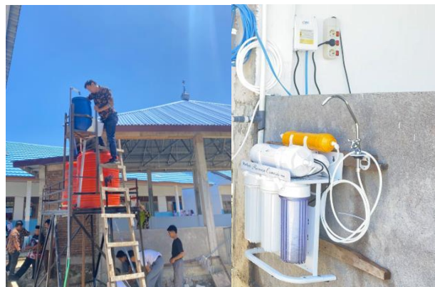
Gambar 4. Pemasangan batu zeolit, kain penyaring, karbon aktif, silika, aerator dan sarang tawon untuk aerasi dan pemasangan mesin reverse osmosis

Berdasarkan hasil analisis diperoleh rata-rata nilai tes awal untuk 12 responden yang mengisi tes yaitu rata-rata 23,33 kemudian untuk tes akhir diperoleh nilai rata-rata yaitu 65. Berdasarkan hasil perhitungan diperoleh nilai gain sebesar 0,54 yang menunjukkan terjadi peningkatan pemahaman pada level sedang. Berikut beberapa dokumentasi kegiatan.