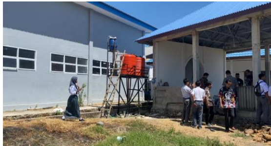
Gambar 2. Pelaksanaan praktik langsung dan transfer teknologi

sumur bor yang hanya berkisar 25 – 30 meter. Sedangkan rendahnya air dari mesin reverse osmosis dipengaruhi oleh keterbatasan anggaran sehingga, tim hanya menggunakan mesin RO dengan kapasitas 500 GDP. Namun, secara keseluruhan kegiatan ini telah berhasil mengatasi keterbatasan air di SMK 5 Takalar dimana selama ini sumber air berasal dari warga sekitar yang menjual air per tandon. Hal ini mengakibatkan dana operasional sekolah lebih banyak digunakan untuk pengadaan air. Dengan adanya sumber air dan pengolahan air baku di sekolah, kebutuhan siswa dan guru sudah sangat cukup terpenuhi baik untuk MCK, bersuci maupun konsumsi.