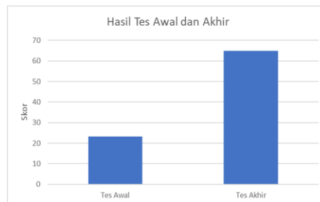
Gambar 3. Perbandingan Rata-Rata Tes Awal dan Akhir

Disisi lain, guru, siswa dan staf teknis sekolah mendapatkan pelatihan langsung terkait operasi dan perawatan sistem penyediaan air bersih dan pengolahan air limbah. Dengan adanya pelatihan ini, mereka mampu menjaga dan memelihara teknologi tersebut secara mandiri. Sistem penyediaan air bersih dan pengolahan air limbah diintegrasikan dengan baik ke dalam operasional sekolah. Proses penyediaan air bersih dan pengolahan limbah berjalan secara efisien, mengurangi penggunaan air berlebih dan menjaga lingkungan sekolah tetap bersih. Tabel dibawah ini menunjukkan perubahan pemahaman guru dan siswa (12 orang) berkaitan dengan pengolahan air bersih dan air limbah sebagai berikut.