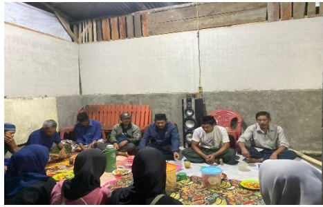
Gambar 1. Focus Group Discussion (FGD) Antara Tim Pengabdian, Aparat Desa, Kelompok Sadar Wisata (Pokdarwis) dan Warga Desa dalam Perumusan Materi Desa Sadar Wisata