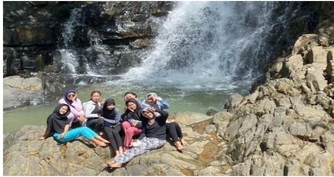
Gambar 3. Potensi Wisata Curug Kanteh Desa Cikatomas

menjulung tinggi dan memiliki 3 buah kolam bertingkat yang bisa dijadikan tempat mandi dan berbasah-basahan di dalamnya. Ditambah dengan gemericik suara air yang menenangkan jiwa