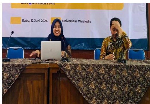
Gambar 2. Pematerian Tentang Penulisan Publikasi Ilmiah

Kegiatan ini tidak hanya bertujuan untuk meningkatkan keterampilan teknis peserta dalam penulisan dan publikasi ilmiah tetapi juga untuk membangun jaringan kerjasama yang lebih kuat antara guru dan dosen dari berbagai daerah (Wibowo, et.al., 2023). Dengan menghadirkan berbagai topik yang komprehensif, pelatihan ini diharapkan dapat memberikan pengetahuan yang mendalam dan praktis yang bisa langsung diterapkan oleh para peserta dalam pekerjaan dan penelitian mereka.