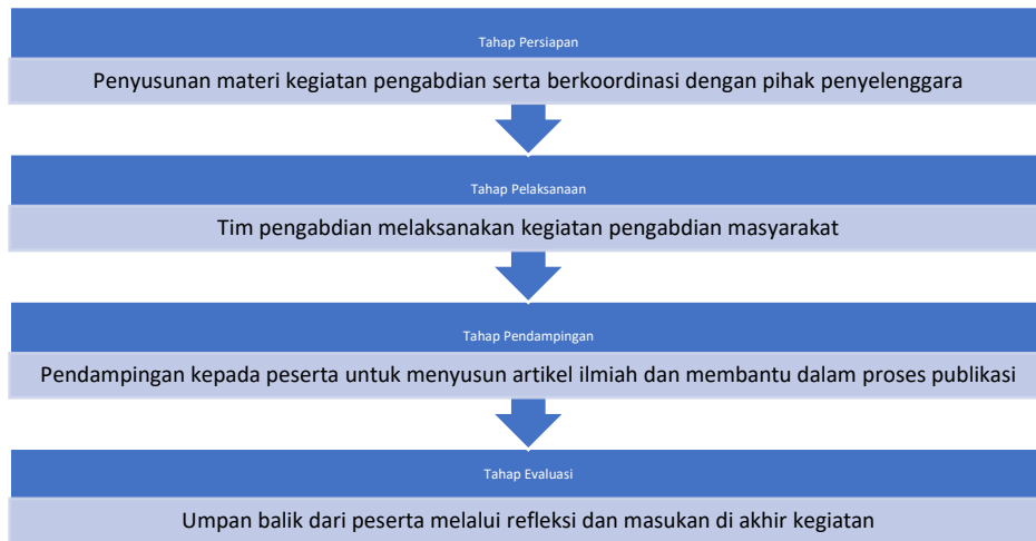
Gambar 1. Tahapan Pengabdian Masyarakat