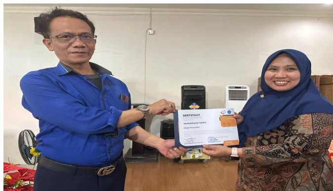
Gambar 4. Penyerahan Sertifikat Pemateri oleh Ketua ISMAPI Jawa Barat

Dengan melakukan refleksi dan mengumpulkan masukan secara sistematis, pelatihan publikasi ilmiah dapat terus ditingkatkan, memastikan bahwa peserta mendapatkan manfaat maksimal dan penyelenggara dapat memenuhi kebutuhan peserta secara lebih efektif (Iswahyudi, et.al., 2023). Proses refleksi ini memungkinkan peserta untuk merenungkan pengalaman belajar mereka, mengidentifikasi pembelajaran yang paling berarti, dan merumuskan cara-cara praktis untuk menerapkan pengetahuan yang diperoleh. Sehingga melalui kegiatan pelatihan publikasi ilmiah dapat terus ditingkatkan, memastikan bahwa peserta mendapatkan manfaat maksimal dan penyelenggara dapat memenuhi kebutuhan peserta secara lebih efektif (Sembiring, T. B., et.al., 2023 dan Wahyuni, F. S & Anisa, A., 2023).