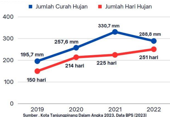
Gambar 1. Potensi Air Hujan di Kota Tanjungpinang

hingga tinggi 4 tahun terakhir dengan jumlah hari hujan minimum 150 dan maksimum 251 hari, artinya ada potensi hujan di Kota Tanjungpinang sepanjang tahun untuk di manfaatkan sumber alternatif air bersih, terutama di Kepulauan Riau (gambar 2). Lalu dilakukan proses desain PAH yang terlihat pada gambar 3. Cara kerja PAH dimulau dengan air hujan jatuh di atap bangunan dan mengalir melalui atap rumah. Air hujan 15 menit pertama tertampung di penangkap debu/kotoran dsb pada pipa 4inch yang sudah di sediakan. Kemudian terkumpul di talang air yang dialirkan dengan pipa menuju bak penampungan air hujan. Air yang tertampung di alirkan melalui pipa distribusi yang di saring menggunakan filter air hujan yang terdiri dari spin down filter dan tabung filter. Air hujan perlu di masak terlebih dahulu apabila akan digunakan untuk air minum. PAH di lengkapi dengan pompa DC dengan sumber arus dari AKI yang di isi menggunakan energi terbarukan berupa Solar Panel. Walaupun daerah pengabdian merupakan daerah yang memadai sumber listrik namun hal ini bertujuan untuk mengetahui model PAH yang cocok di segala kondisi terutama daerah pulau terpencil yang memang tidak ada sumber listrik dari PLN. Sehingga model PAH ini bisa menjadi prototipe untuk pemanfaatan hujan di daerah terpencil dan kepulauan.