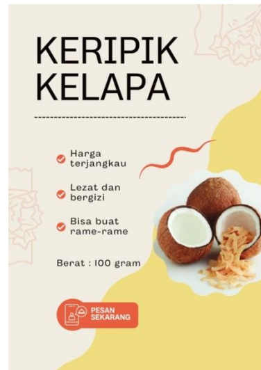
Gambar.2 Kemasan Keripik Kelapa

Selain memberikan pelatihan pembuatan keripik kelapa, dilaksanakan pula pemberian pelatihan mengenai strategi marketing yang ditujukan kepada para pemuda pemudi karang taruna “Tuget Karya”. Kemudian dalam melakukan pemasaran produk keripik kelapa ini lebih memanfaatkan media sosial karena media sosial yang lebih cepat dalam proses pemasaran. Strategi pemasaran online (online marketing strategy) merupakan segala bentuk usaha yang berkaitan dengan bisnis guna memasarkan suatu produk ataupun jasa melalui media online yakni internet (Setiawati & Widyartati, 2017).