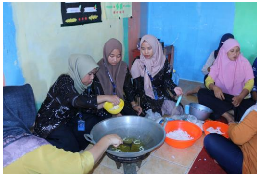
Gambar 4. Pelatihan Pembuatan Keripik Kelapa Bersama Anggota PKK

Selain memberikan pelatihan pembuatan keripik kelapa, dilaksanakan pula pemberian pelatihan mengenai strategi marketing yang ditujukan kepada para pemuda pemudi karang taruna “Tuget Karya”. Kemudian dalam melakukan pemasaran produk keripik kelapa ini lebih memanfaatkan media sosial karena media sosial yang lebih cepat dalam proses pemasaran. Strategi pemasaran online (online marketing strategy) merupakan segala bentuk usaha yang berkaitan dengan bisnis guna memasarkan suatu produk ataupun jasa melalui media online yakni internet (Setiawati & Widyartati, 2017).