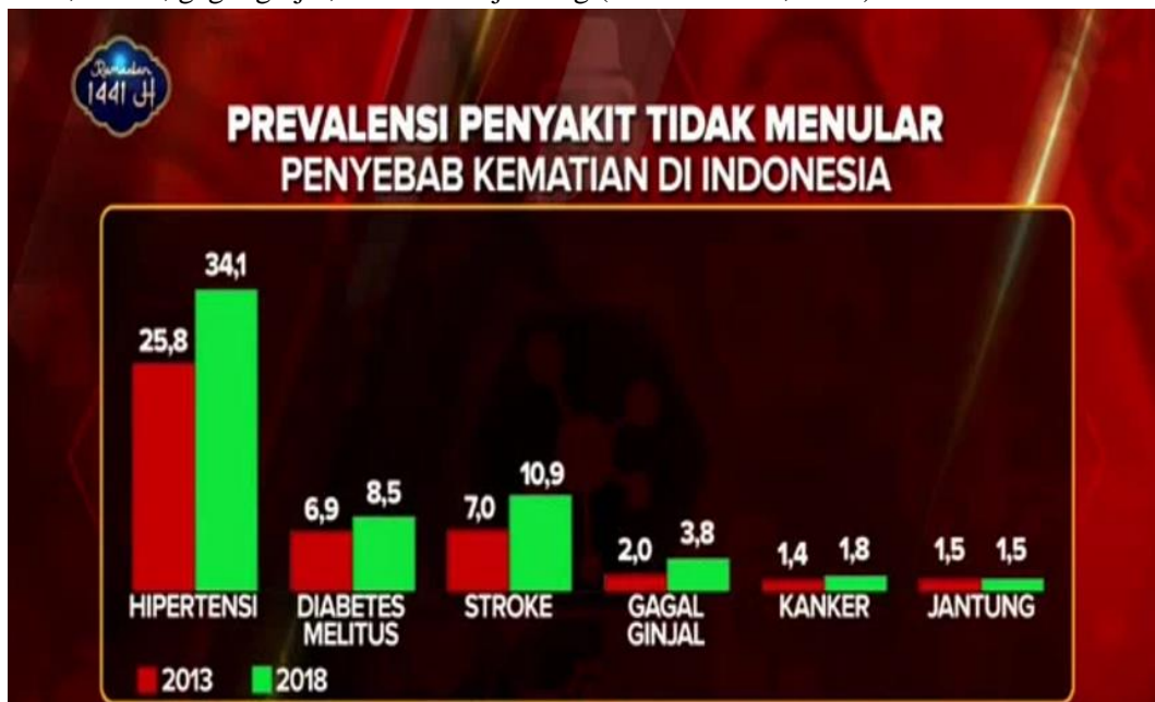
Gambar 2. Materi Tentang Prevalensi Penyakit Tidak Menular Penyebab Kematian Di Indonesia

tidak menular yang menjadi penyebab kematian di Indonesia antara lain hipertensi, diabetes mellitus, stroke, gagal ginjal, kanker dan jantung (Kemenkes RI, 2018).