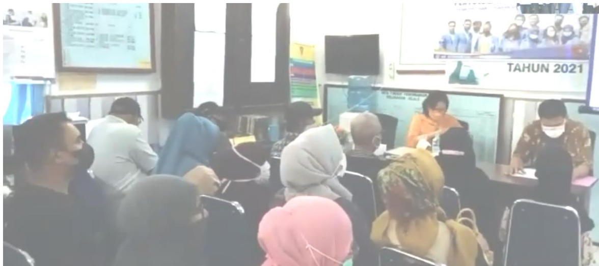
Gambar 5. Sesi Tanya Jawab

Gambar 4 dan 5 menunjukkan proses penyuluhan yaitu penyajian materi dan tanya jawab oleh peserta penyuluhan. Penyuluhan berlangsung lancar dan baik. Setelah penyuluhan selesai hampir semua peserta antusias untuk melakukan perilaku hidup sehat serta rutin memeriksakan kesehatan di fasilitas kesehatan terdekat. Hal ini disebabkan karena mereka baru mengetahui bahwa orang yang menderita penyakit tidak menular sebagian besar tidak mengetahui dirinya menderita penyakit tersebut karena merasa baik-baik saja dan tidak pernah memeriksakan kesehatan secara rutin. Berdasarkan hal tersebut maka penulis dapat mengatakan bahwa penyuluhan tersebut berhasil menambah pengetahuan masyarakat yang hadir di Kelurahan Silale tentang penyakit tidak menular. Hal ini didukung juga oleh beberapa peneliti yang mengungkapkan bahwa pendidikan masyarakat dapat meningkatkan pengetahuan peserta penyuluhan tentang