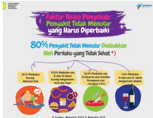
Gambar 3. Materi Faktor Risiko Penyakit Tidak Menular

Pada gambar 3 di atas dapat dilihat bahwa faktor risiko penyakit tidak menular antara lain kurang aktivitas fisik, kurang konsumsi sayur dan buah, konsumsi tinggi gula, konsumsi tinggi natrium/garam, obesitas, merokok dan konsumsi alkohol. Selain itu, Rahmah dan Achmad mengungkapkan bahwa kualitas tidur dan riwayat keluarga merupakan faktor risiko yang berhubungan dengan kejadian hipertensi (Rahmah et al., 2019). Penelitian lain juga menemukan bahwa kurang aktifitas fisik, stress, obesitas dan semakin tua seseorang maka memiliki risiko lebih besar untuk menderita penyakit stroke dan jantung coroner ((Marleni & Alhabib, 2007)(Pratiwi et al., 2018)(Malahayati, 2020).