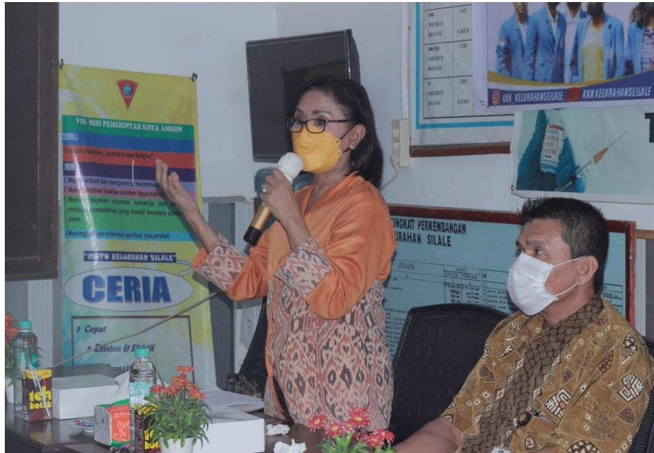
Gambar 4. Penyajian Materi Penyuluhan