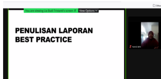
Gambar 1. Pemberian Materi Penulisan Best Practice

Kegiatan pengabdian ini dilakukan di SMP YPM Mojowarno Jombang secara daring pada tanggal 12 – 24 Juli 2021, hal ini dikarenakan untuk mencegah penyebaran covid-19. Terdiri dari 15 peserta guru SMP YPM Mojowarno.