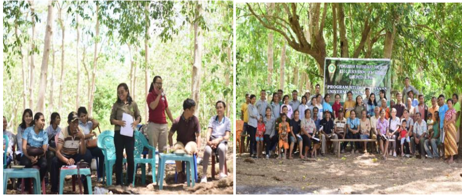
Gambar 2. Pelatihan Pembuatan Pupuk EMOL dan Foto Bersama Peserta Kegiatan Pengabdian Kepada Masyarakat.

Evaluasi pencapaian dilakukan secara kualitatif melalui diskusi bersama dengan masyarakat sebagai partisipan kegiatan pengabdian kepada masyarakat. Pertanyaan indikator dalam evaluasi pencapaian adalah apakah substansi materi pelatihan bermanfaat bagi masyarakat? Dari pertanyaan indikator yang diberikan seluruh partisipan sepakat menjawab “Ya”, bahwa kegiatan Pengabdian kepada Masyarakat ini sangat bermanfaat dan dapat membantu masyarakat petani khususnya dalam memanfaatkan limbah rumah tangga maupun limbah pertanian. Menurut (Simatupang et al., 2023), keterbatasan biaya, peralatan dan sumber daya manusia merupakan alasan mengapa masyarakat cenderung tidak mau belajar mengembangkan diri dan mempelajari hal-hal yang bermanfaat. Selain evaluasi pencapaian bersama partisipan kegiatan, evaluasi pencapaian juga dilakukan oleh pelaksana kegiatan terhadap sasaran dan tahapan kegiatan, dimana sasaran kegiatan tercapai karena masyarakat terlibat aktif sedangkan dari sisi tahapan kegiatan mulai dari persiapan sampai pelaksanaan tidak ada kendala yang berarti karena adanya kerjasama yang baik antara pihak pelaksana dengan pemerintah desa setempat serta seluruh masyarakat yang terlibat dalam kegiatan ini.