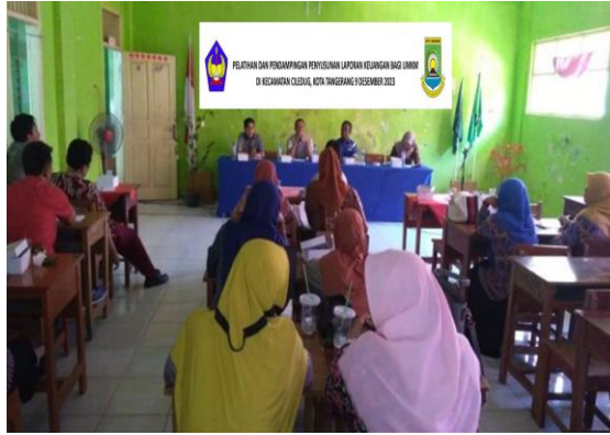
Gambar: 2 Presentasi oleh narasumber penyusunan laporan keuangan.

UMKM sendiri merupakan sektor yang vital bagi perekonomian nasional, dimana UMKM dapat memberikan kontribusi yang besar dalam meningkatkan perekonomian, menciptakan lapangan kerja, serta meningkatkan kesejahteraan masyarakat. Namun, UMKM sering menghadapi berbagai tantangan, salah satunya adalah masalah pengelolaan keuangan. Hal ini disebabkan oleh minimnya pengetahuan dan kesadaran pemilik UMKM dalam mengelola keuangan. Kondisi ini sering mengakibatkan UMKM mengalami kesulitan dalam mengembangkan usaha mereka. Dalam konteks ini, penting bagi UMKM untuk memahami konsep dasar akuntansi dan penerapannya dalam pengelolaan keuangan bisnis. UMKM harus dapat memahami pentingnya pembukuan keuangan yang teratur dan akurat, sehingga dapat memberikan gambaran yang jelas tentang kondisi keuangan bisnis mereka.