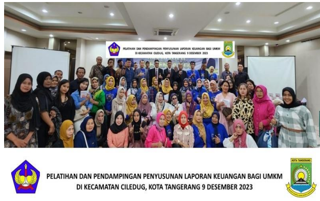
Gambar 3. Peserta pelatihan dan pendampingan

Selain itu, inovasi dalam pelaporan keuangan juga perlu dilakukan untuk meningkatkan efektivitas pengelolaan keuangan pada UMKM. Inovasi dapat dilakukan dengan menciptakan metode pelaporan keuangan yang lebih sederhana dan mudah dipahami. Dalam hal ini, UMKM dapat memanfaatkan teknologi untuk menciptakan metode pelaporan keuangan yang lebih efektif dan efisien. Pengelolaan keuangan yang baik dan benar sangat penting dalam keberhasilan usaha UMKM.