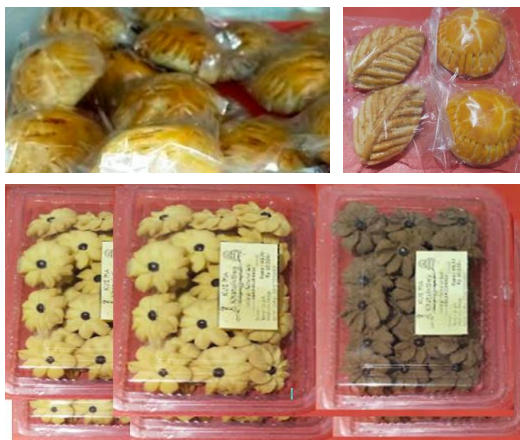
Gambar 3. Kemasan produk lama