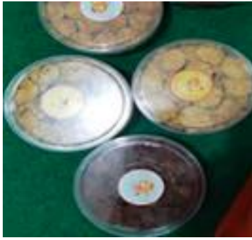
Gambar 5. Kemasan baru dengan toples transparan