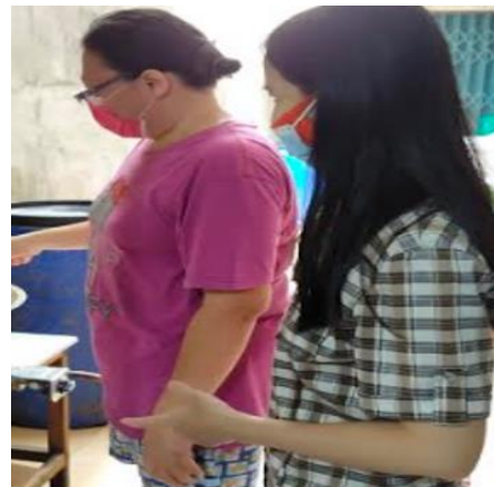
Gambar 4. Diskusi dengan mitra