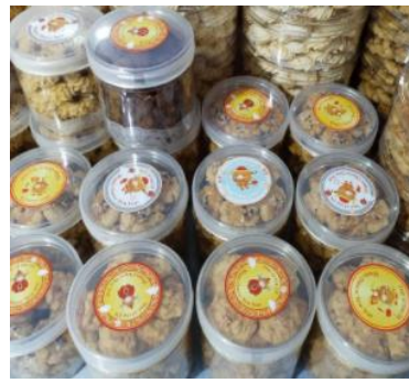
Gambar 6. Kemasan baru dengan toples mika

Kegiatan kedua yang dilakukan adalah mengenai mitra cara memanfaatkan media sosial instagram untuk memasarkan produk. Penulis membuat akun Instagram bisnis sambil menjelaskan cara mengupload foto produk dan komunikasi dengan pelanggan. Melalui kedua kegiatan ini, mitra mulai memahami pentingnya digital marketing dalam memasarkan produk. Mitra antusias dalam mempelajari cara menampilkan foto produk dan caption yang menarik di instagram.