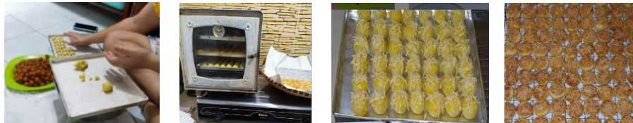
Gambar 2. Proses Produksi Kue Kering

Tahapan awal pelaksanaan kegiatan adalah melakukan observasi langsung ke lokasi pembuatan kue kering. Penulis dapat melihat langsung proses pembuatan kue kering dari awal sampai pengemasan dan pemasaran produk. Jenis kue kering yang dihasilkan mitra cukup beragam, seperti: nastar, semprit, putri salju, kastengel, lidah kucing, stik keju, lumpia udang, dan cornflakes. Diluar dari jenis kue kering yang rutin dibuat, mitra juga bersedia menerima jenis kue tertentu berdasarkan order pelanggan. Melalui observasi ini diharapkan dapat mengidentifikasi masalah yang dihadapi mitra dalam memasarkan produknya.