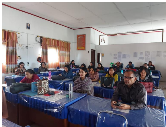
Gambar 4. Peserta Workshop PKM di SMA Negeri 2 Siborongborong

Dari hasil diskusi dan tanya jawab di dalam workshop ini ditemukan bahwa beberapa dari guru masih memerlukan pelatihan berkelanjutan untuk menegaskan bahwa ada ide dan pertanyaan-pertanyaan yang ingin diformulasikan sehingga ilmiah dan objektif. Sehingga pikiran yang terbelenggu, takut dan bimbang untuk melakukan sebuah PTK dapat menemukan jawaban dan bervariasi (Somali et al., 2021). Antusias yang diperlihatkan oleh para guru tersebut ditunjukkan dengan memberikan usul dan masukan kepada Kepala Sekolah untuk melakukan Workshop lanjutan dengan topik dan teknis yang lebih variatif (Forson et al., 2021).