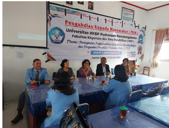
Gambar 3. Sambutan Kepala Sekolah

Dari hasil diskusi dan tanya jawab di dalam workshop ini ditemukan bahwa beberapa dari guru masih memerlukan pelatihan berkelanjutan untuk menegaskan bahwa ada ide dan pertanyaan-pertanyaan yang ingin diformulasikan sehingga ilmiah dan objektif. Sehingga pikiran yang terbelenggu, takut dan bimbang untuk melakukan sebuah PTK dapat menemukan jawaban dan bervariasi (Somali et al., 2021). Antusias yang diperlihatkan oleh para guru tersebut ditunjukkan dengan memberikan usul dan masukan kepada Kepala Sekolah untuk melakukan Workshop lanjutan dengan topik dan teknis yang lebih variatif (Forson et al., 2021).