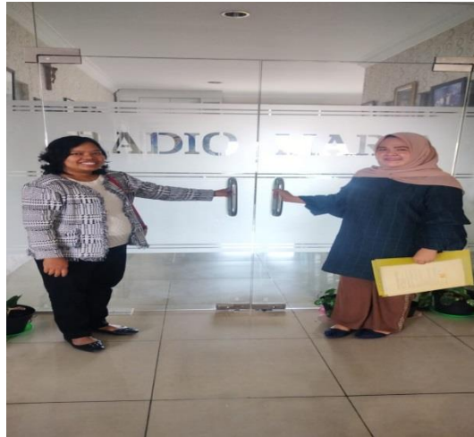
Gambar 1. Pintu Masuk ke RMI di Lantai 5 Chatolic Centre Building