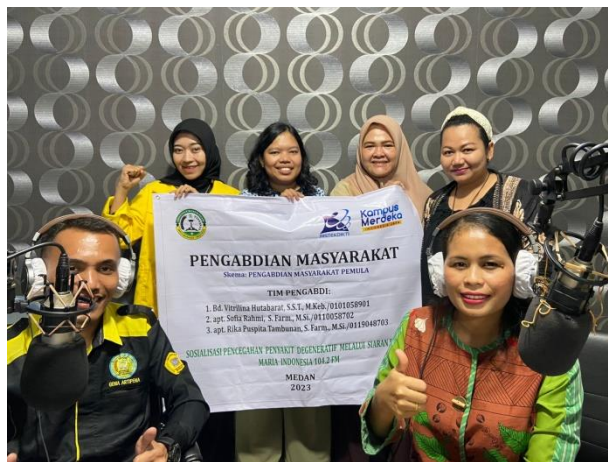
Gambar 3. Tim Pengabdian Sedang Melakukan Kegiatan Siaran Radio

Solusi dari permasalahan yang ada yaitu mendatangkan narasumber dan penyiar dari tim Kesehatan dari Institut Kesehatan Deli Husada Deli Tua untuk melakukan siaran live di RMI tentang Kesehatan, sehingga tidak ada lagi rekaman siaran Kesehatan tiap minggu pada program Kesehatan. Evaluasi terhadap sosialisasi Kesehatan dalam bentuk siaran live dilakukan pemantauan Kesehatan sekali sebulan. Dengan parameter pengukuran lingkaran perut dan tekanan darah, pengukuran tinggi badan, berat badan, IMT, kalori dan lemak tubuh, pengukuran kadar gula darah, kolesterol dan asam urat. Sehingga evaluasi dapat diukur yaitu dengan tercapainya pola hidup sehat karena mendapat asupan makanan yang mempunyai nilai gizi tinggi untuk para pendengar RMI. Maka akan terpenuhinya nilai normal dari KGD, kolesterol, asam urat IMT, jumlah kalori, jumlah lemak dalam tubuh sehingga penyakit degeneratif dapat diminimalkan [10;11;12;13;14]. Untuk menambah audiensi dari kaum muda, maka ditunjuk penyiar dari mahasiswa farmasi untuk memandu siaran live. Beberapa topik-topik dibuat menarik untuk kaum muda dengan Bahasa informal dan sehari-hari sehingga mudah dipahami dan tidak terlalu formal [3;4;5]. Dengan bertambahnya interaktif setiap minggu dari kaum muda maka evaluasi untuk minat kaum muda terhadap radio dapat diukur.