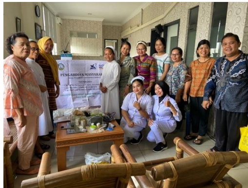
Gambar 5. Pemeriksaan Kesehatan pada posko Kesehatan yang dilakukan di Radio Maria Indonesia 104,2 FM

Evaluasi untuk mendapatkan audiens kaum dilihat dari parameter yang dapat diukur dari banyaknya kaum muda yang bertanya dan yang datang saat diadakannya posko Kesehatan. Dan banyaknya kaum muda yang terpenggil untuk menjadi penyiar di RMI dengan berkomitmen menyiar secara live. dengan cara mendaftar di website resmi www.radiomaria.co.id atau langsung mendaftar di RMI merupakan evaluasi keberlanjutan yang terjadi setelah program pengabdian selesai. Para pendengar sangat antusias dalam mendengarkan siaran radio tentang Kesehatan yang dapat dilihat 5-8 pertanyaan dalam setiap siaran yang dilakukan selama 1 jam berlangsung tanpa ada jeda untuk lagu. Penyiar yang membantu adalah mahasiswa dari prodi farmasi dan prodi kebidanan yang telah dilatih sebagai penyiar dan operator oleh pelatih dari RMI.