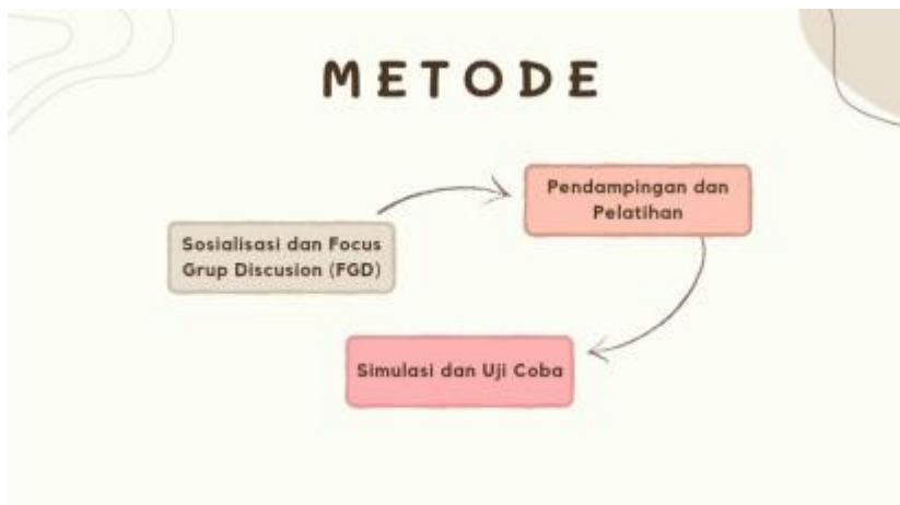
Gambar 1. Bagan Alur Metode Pengabdian

Tahap ini merupakan tahap terakhir dalam pengimplementasian digital marketing pada UMKM Rawonsae. Dalam tahap ini, penulis bekerja sama dengan pelaku UMKM untuk melakukan simulasi dan uji coba setelah sudah mendaftar pada aplikasi pemasaran digital. Pelaku UMKM Rawonsae juga akan dibimbing oleh penulis mulai dari cara menerima pesanan hingga memberikan pesana kepada jasa pengantar.