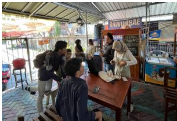
Gambar 5. Pelaksanaan Uji Coba dan Simulasi

ketidapkahaman terkait prosedur penerimaan pesanan.