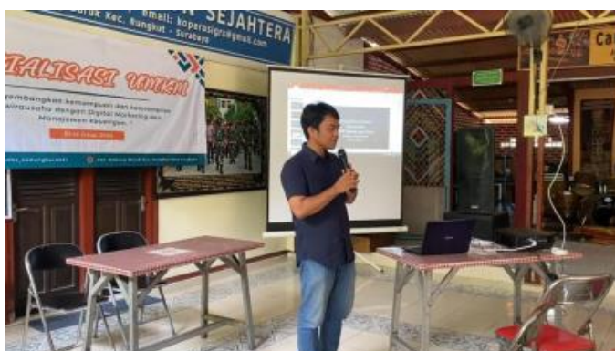
Gambar 2. Pelaksanaan Sosialisasi