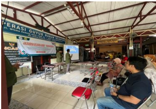
Gambar 3. Pelaksanaan Focus Grup Discussion

Setelah melakukan kegiatan FGD dan mengetahui kendala yang dihadapi, mahasiswa Bina Desa Kelurahan Kedung Baru merancang kegiatan yang dapat membantu Rawonsae untuk melakukan pemasaran secara online beserta cara pengaplikasiannya dengan melakukan pendampingan dan pelatihan digital marketing.