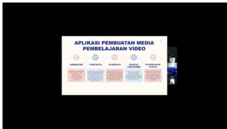
Gambar 2. Materi Aplikasi Video Youtube

Penyuluhan satu hari memfokuskan dalam pembuatan Langkah-langkah mengupload video di media youtube dan cara menggunakan aplikasi video. Setelah penyampaian materi dilaksanakan sesi tanya jawab. Seluruh guru SMK Yapermas terlihat antusias dalam mengajukan pertanyaan kepada tim.