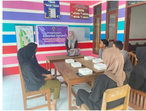
Gambar 1. Foto Dokumentasi Penyampaian Materi

Sesi selanjutnya yaitu pelatihan trading saham, peserta diajarkan bagaimana cara memilih saham yang baik untuk dibeli, cara membeli dan menjual saham dan melakukan analisa dalam melihat pergerakan harga saham dan kapan waktu yang tepat untuk membeli dan menjual saham. Pada simulasi ini peserta diajarkan tentang mekanisme perdagangan saham yang ada di Bursa Efek Indonesia. Sebagai tindak lanjut kegiatan ini pemuda karang taruna Desa Sukosari juga diberikan kesempatan untuk dapat bergabung pada Galery Investasi Universitas Kadiri. Hasil utama dari kegiatan pengabdian masyarakat telah tercapai yaitu meningkatnya pengetahuan dan kemampuan pemuda karang taruna dalam berinvestasi saham sehingga mampu meningkatkan nilai kekayaan dimasa yang akan datang.