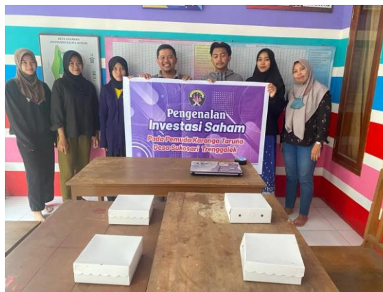
Gambar 2. Foto Dokumentasi Kegiatan

Sesi selanjutnya yaitu pelatihan trading saham, peserta diajarkan bagaimana cara memilih saham yang baik untuk dibeli, cara membeli dan menjual saham dan melakukan analisa dalam melihat pergerakan harga saham dan kapan waktu yang tepat untuk membeli dan menjual saham. Pada simulasi ini peserta diajarkan tentang mekanisme perdagangan saham yang ada di Bursa Efek Indonesia. Sebagai tindak lanjut kegiatan ini pemuda karang taruna Desa Sukosari juga diberikan kesempatan untuk dapat bergabung pada Galery Investasi Universitas Kadiri. Hasil utama dari kegiatan pengabdian masyarakat telah tercapai yaitu meningkatnya pengetahuan dan kemampuan pemuda karang taruna dalam berinvestasi saham sehingga mampu meningkatkan nilai kekayaan dimasa yang akan datang.