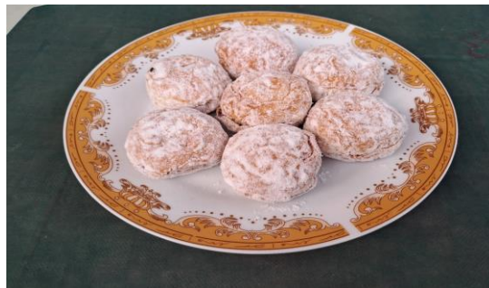
Gambar 4. Bomboloni yang Telah Siap disantap

Proses pengembangan ini kurang lebih 2 jam, setelah itu dilanjutkan ke proses penggorengan. Setelah penggorengan selesai bomboloni tersebut diberi topping dan gula halus.