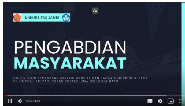
Gambar 7. Tampilan depan Video

Tim pengabdian telah membuat video pengabdian kepada Masyarakat yang bisa diakses secara publik di link https://www.youtube.com/watch?v=ChvBuYGwGm8&pp=ygUMbXVsdGFoYWRhaCBj . Berikut screen shot tampilan videonya: