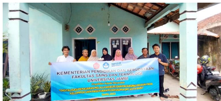
Gambar 5. Tim Pengabdian Bersama UMKM Aneka Kreasi

Selanjutnya, tim pengabdian Bersama UMKM Aneka Kreasi melanjutkan pembicaraan terkait rencana kegiatan selanjutnya mengenai sosialisasi pengelolaan website yang telah dimasuki video, foto-foto produk serta informasi terkait penjual produk tersebut. Setelah itu tim pengabdian melakukan foto Bersama.