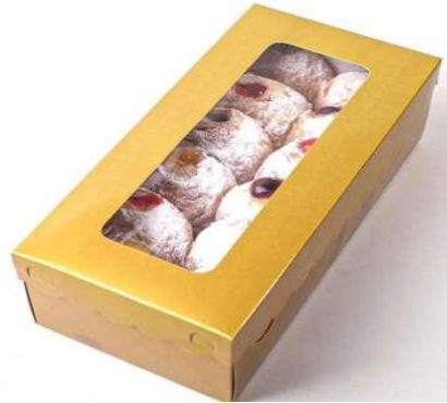
Gambar 6. Kotak Bomboloni

Tim pengabdian sudah menyiapkan packaging produk bomboloni karena selama ini anggota UMKM untuk produk bomboloni hanya menggunakan kantong plastik dalam proses penjualannya. Berikut kotak untuk bomboloni: