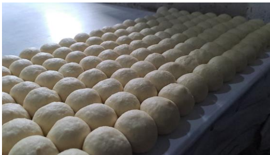
Gambar 3. Bomboloni didiamkan hingga Mengembang

Proses pengembangan ini kurang lebih 2 jam, setelah itu dilanjutkan ke proses penggorengan. Setelah penggorengan selesai bomboloni tersebut diberi topping dan gula halus.