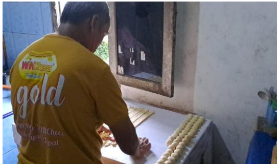
Gambar 2. Proses Pembulatan Bomboloni

kegiatan yang akan dilakukan serta menjelaskan tujuan kegiatan ini. Setelah itu dilakukan pengabdian video proses pembuatan Produk.